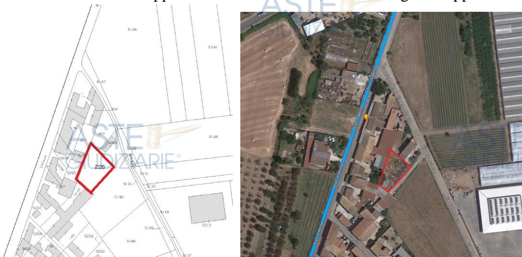
Individuazione del terreno e confronto con l’estratto di mappa catastale

Al fine di individuare esattamente il terreno pignorato, la scrivente ha provveduto a reperire la foto satellitare dell’area da Google Maps, la quale è stata messa a confronto con l’estratto di mappa catastale del terreno, come di seguito rappresentato.