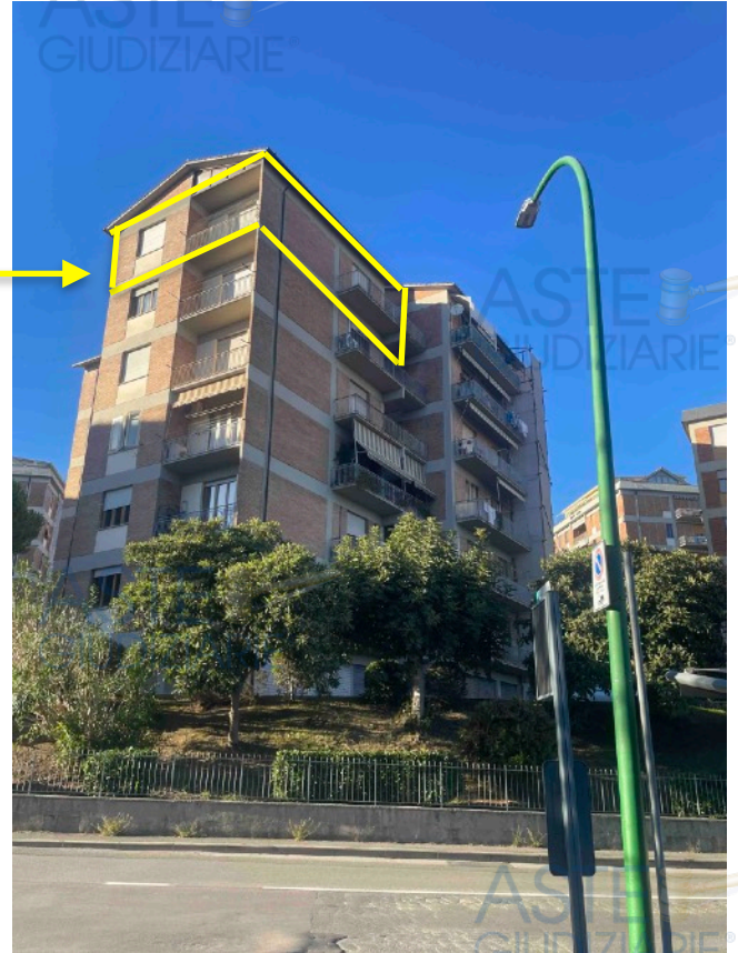
Fronte da V. Colombini