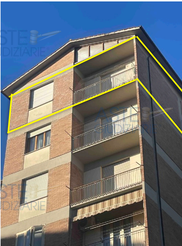
Particolare balcone V. Colombini