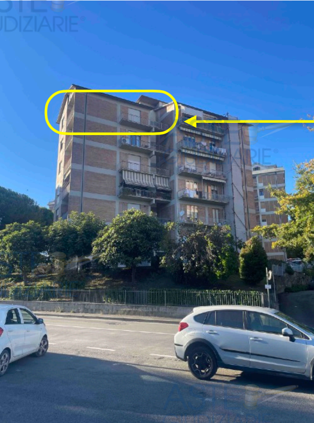
Fronte da V. Colombini