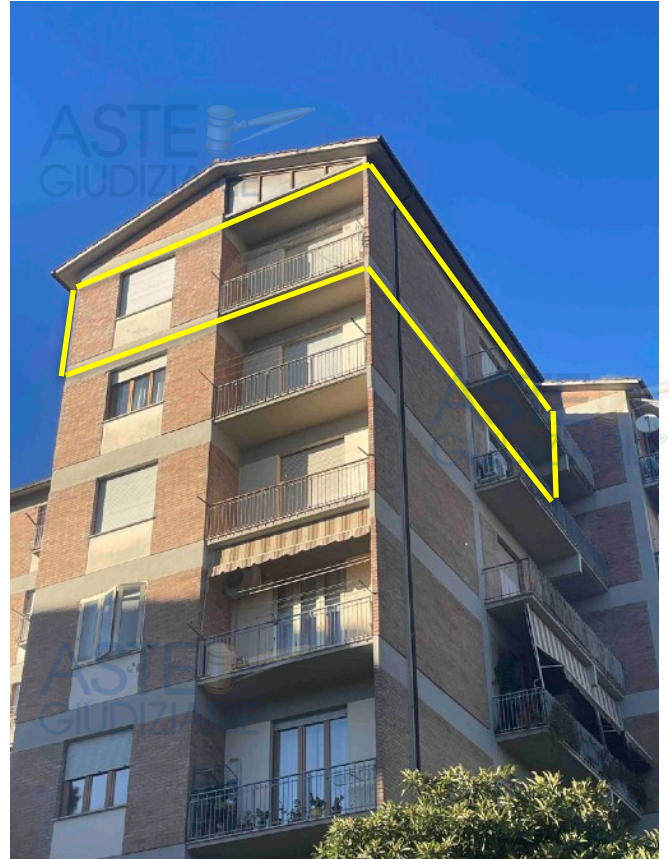
Particolare facciata V. Colombini