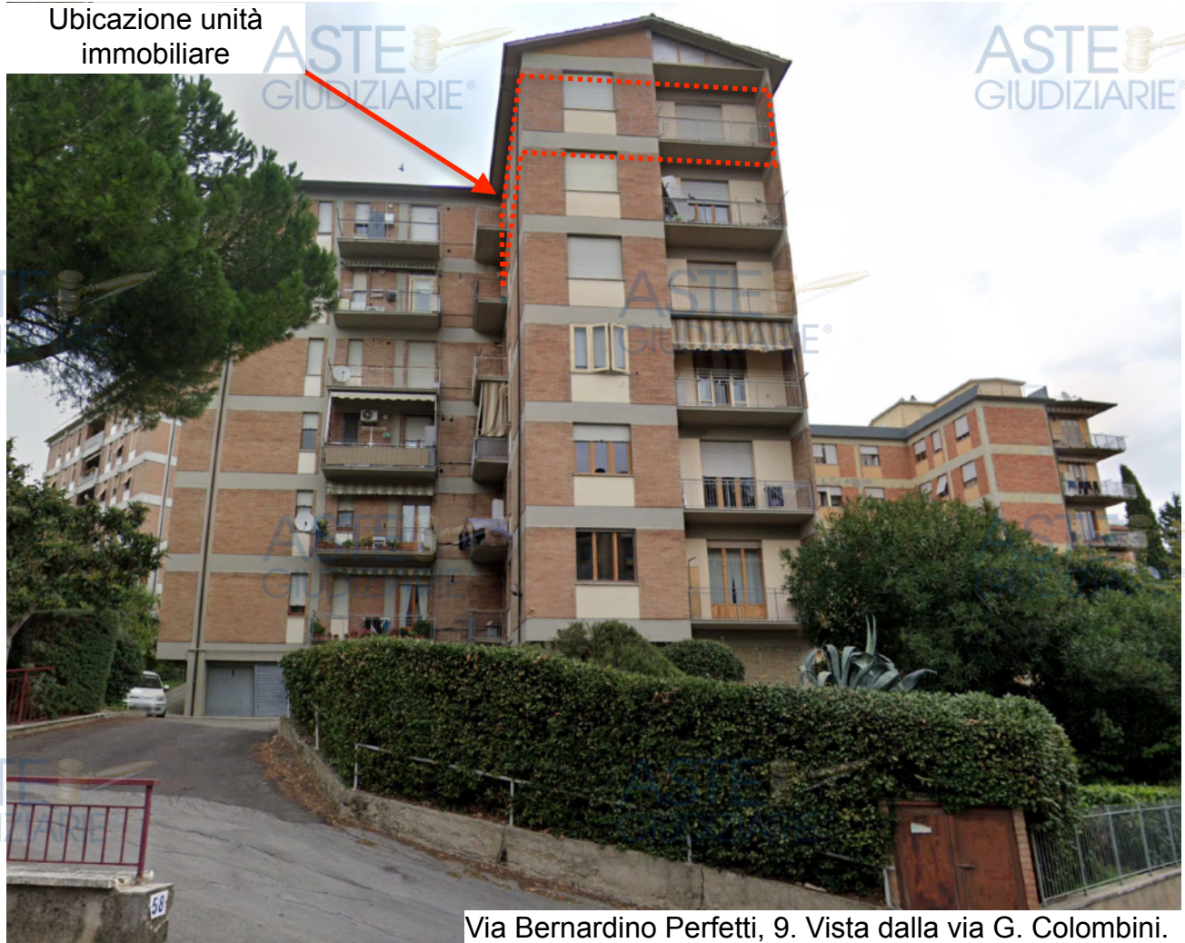
Via Bernardino Perfetti, 9. Vista dalla via G. Colombini.

ESECUZIONE IMMOBILIARE N.R.G.E.I. 002/2024