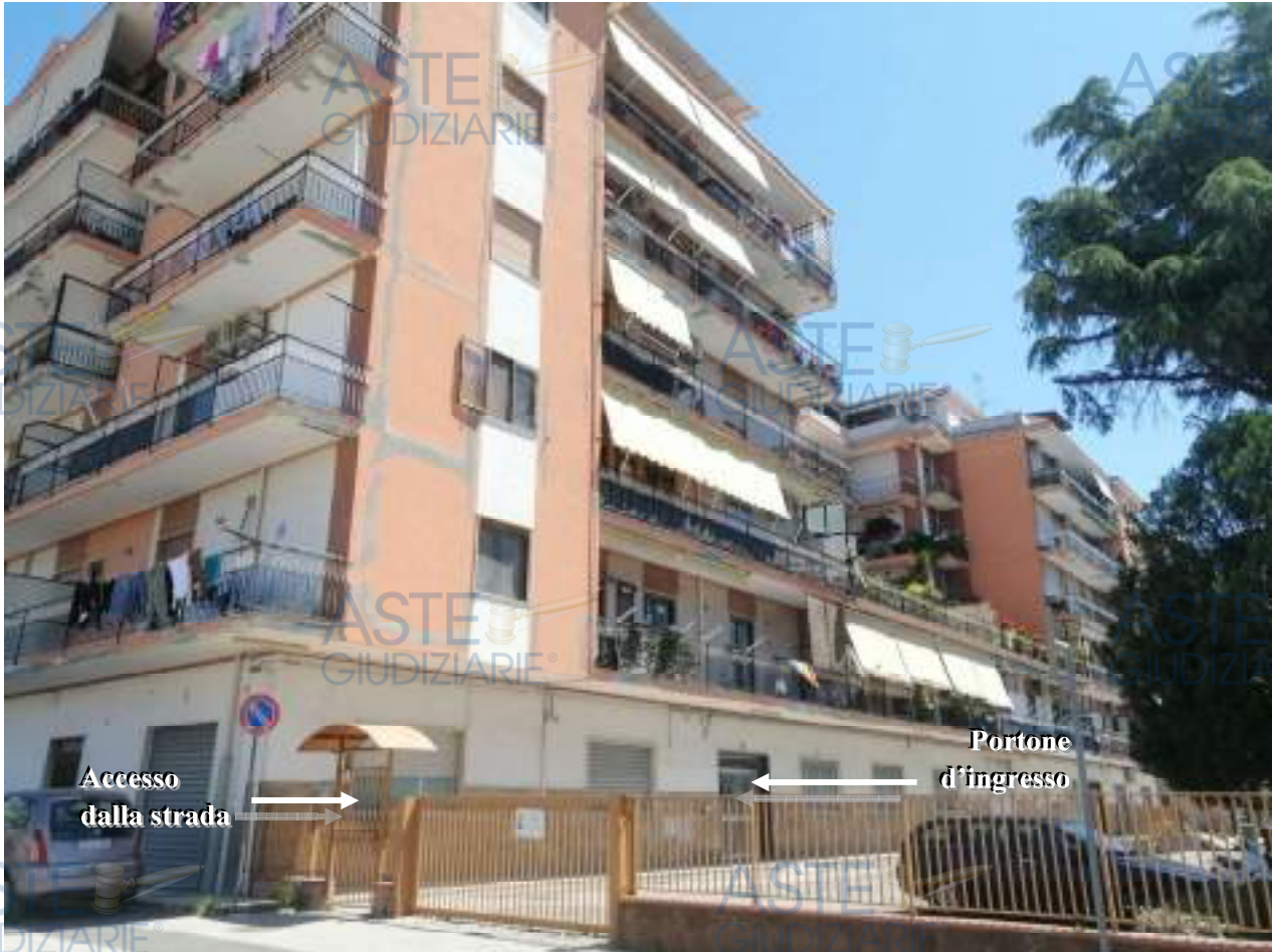
Foto esterna del Fabbricato

Il bene oggetto di pignoramento è costituito da un appartamento situato al secondo piano - scala B del suddetto edificio ed è dotato di un ampio terrazzo che corre lungo tre lati dell'appartamento.