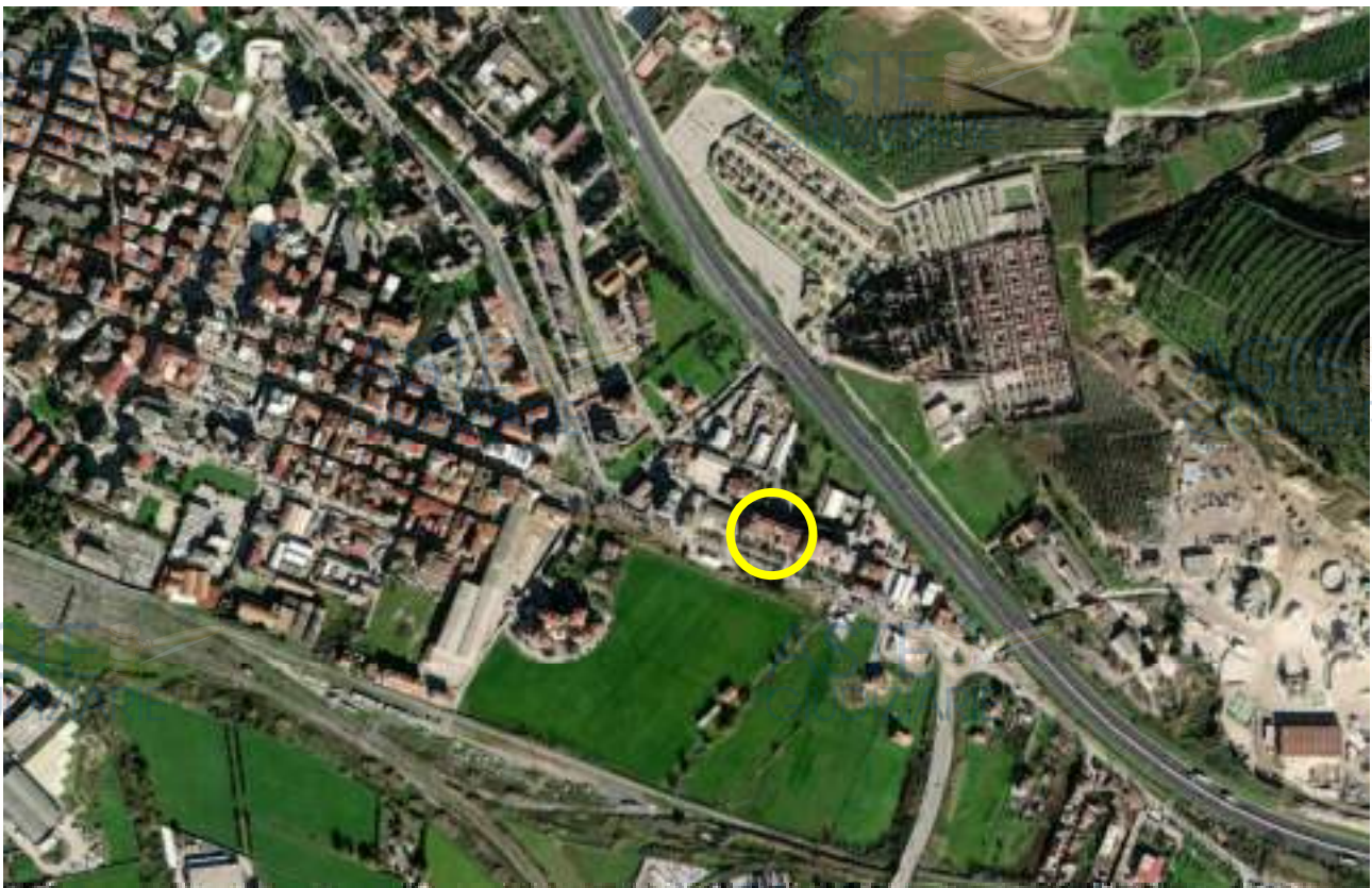
Identificazione immobile su ortofoto

Oltre ad essere dotata dell'omonima uscita autostradale sulla A2 Autostrada del Mediterraneo, ben connessa con un viadotto alla Strada statale 18 Tirrena Inferiore, principale collegamento con il Cilento, da Battipaglia inizia la Strada statale 19 delle Calabrie, che collega la Piana del Sele alla Basilicata e al Vallo di Diano. L'immobile in oggetto è situato poco distante dal centro abitato di Battipaglia a circa 800 mt ed in prossimità dell'uscita dalla Statale 18 per Agropoli dalla quale dista circa 2,5 km e dell'Autostrada Salerno Reggio Calabria dalla quale dista circa 3 km. Il territorio cittadino di Battipaglia è tra le aree agricole maggiormente produttive della piana del Sele, l'immobile è situato a circa 10 km dal mare.