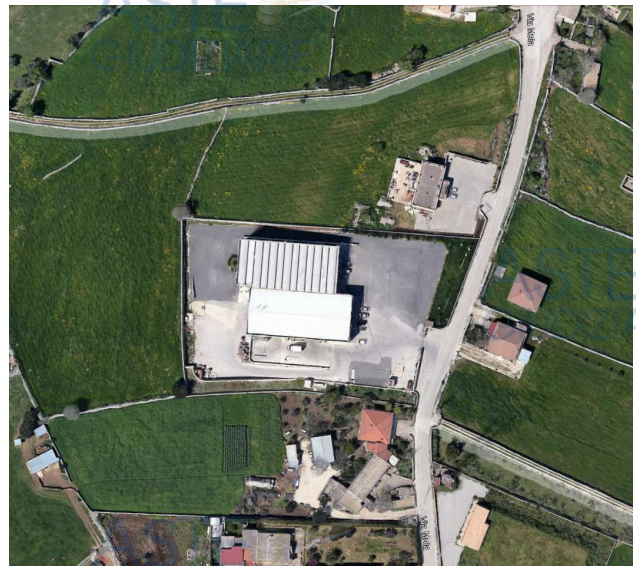
Estratto del foglio di mappa *** di Modica particella **** Foto aerea dell'immobile