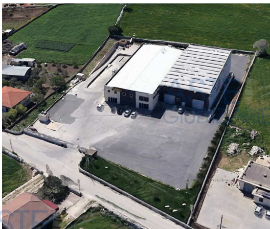
Prospetto fronte strada