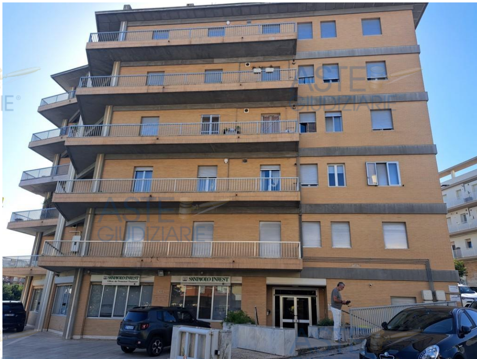
Prospetto immobile su c.so Vittorio Veneto

L'appartamento, identificato al sub.8, si trova al terzo piano del condominio