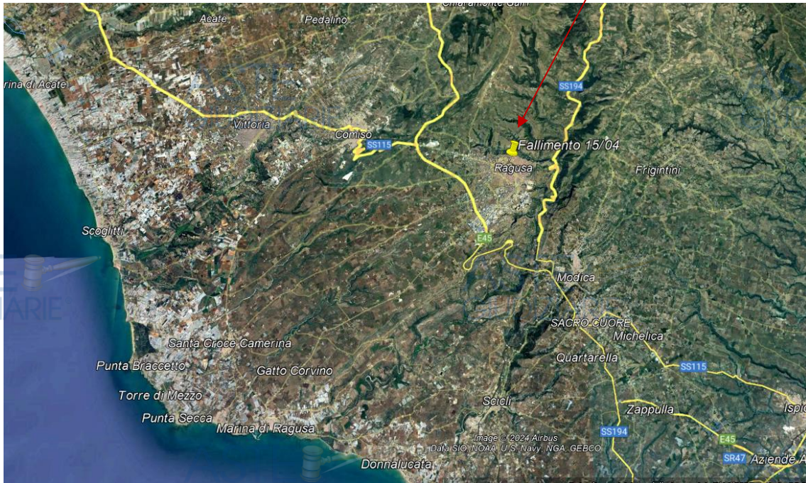
Inquadramento urbanistico