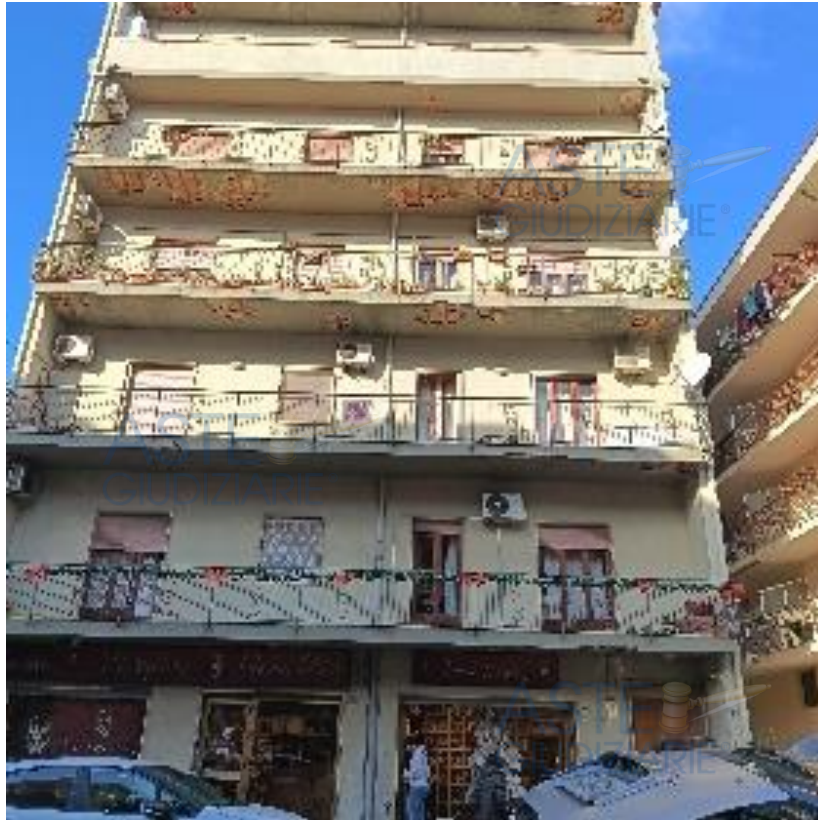
PROSPETTO FABBRICATO CON EVIDENTI PARTI AMMALORATE in particolare sottobalconi

L'intero fabbricato presenta i sotto balconi con evidenti zone ammalorate che necessitano di intervento di ripristino.