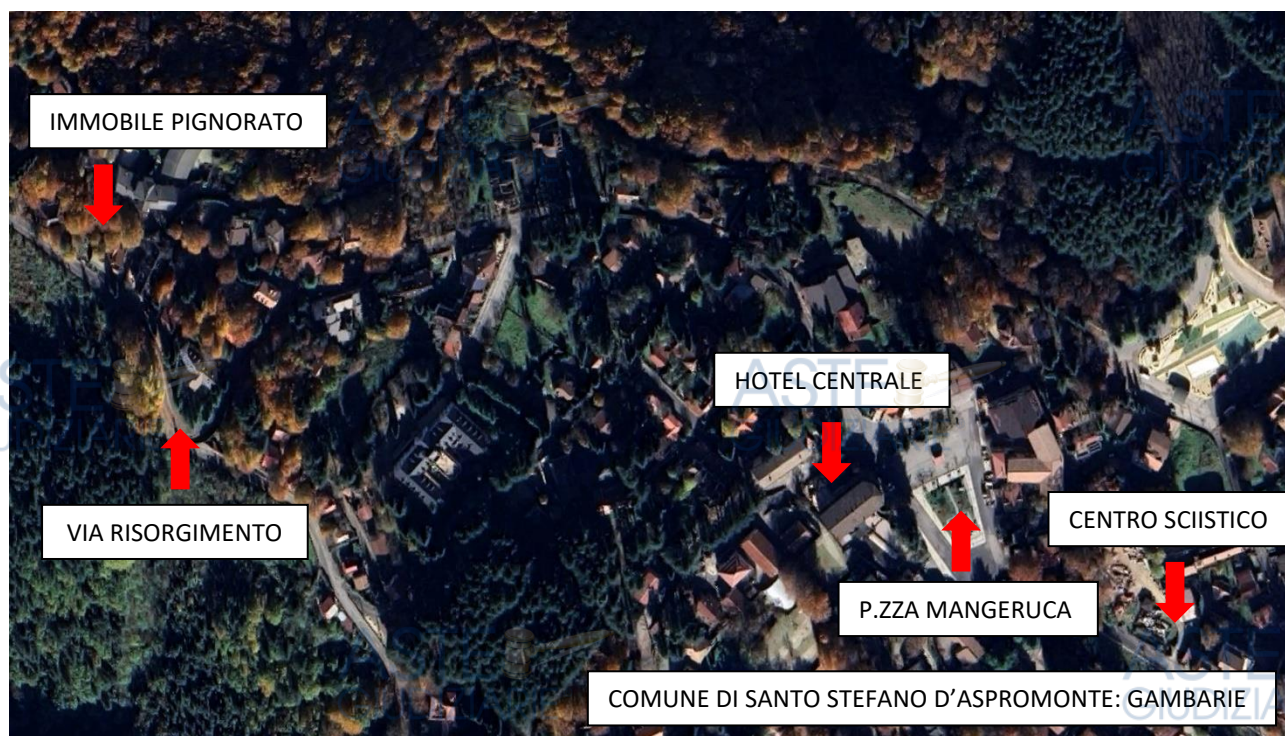
Vista generale del contesto in cui è inserito il bene pignorato.

L'abitazione è posta al primo ed ultimo piano (2° f.t.) di un fabbricato isolato, realizzato con tipologia edilizia assimilabile a villino, sormontato da una copertura a falde inclinate ( foto 7 ).