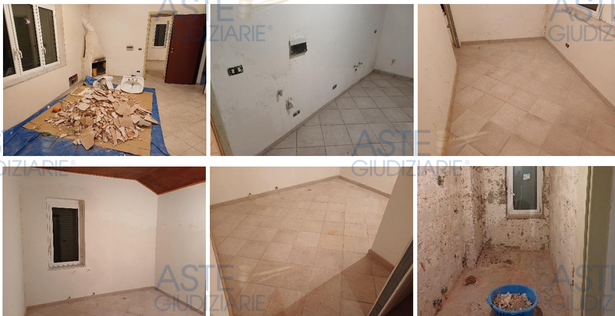
Vista di alcuni locali interni dell'abitazione (riproduzione completa in All.03b ).

Il servizio igienico (ambiente 4), dotato di finestra, risulta completamente demolito, ad eccezione della sola impiantistica sottotraccia. Risultano mancanti tutti i sanitari, i rivestimenti e la pavimentazione, in parte stoccati nel soggiorno (foto n° 29 , 30 ).