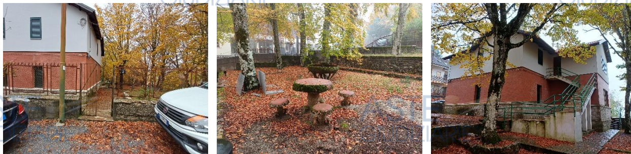
Vista esterna dell'ingresso pedonale, dell'area di pertinenza esclusiva del subalterno 10 e della scala di accesso al piano primo (ripresa completa in All.03a ).

La scala di accesso al piano primo, nonché l'androne di ingresso posto al medesimo livello, che disimpegna le due unità abitative ivi collocate, risultano identificati catastalmente con il subalterno 8 e costituiscono beni comuni non censibili a servizio dei subalterni 9 e 10.