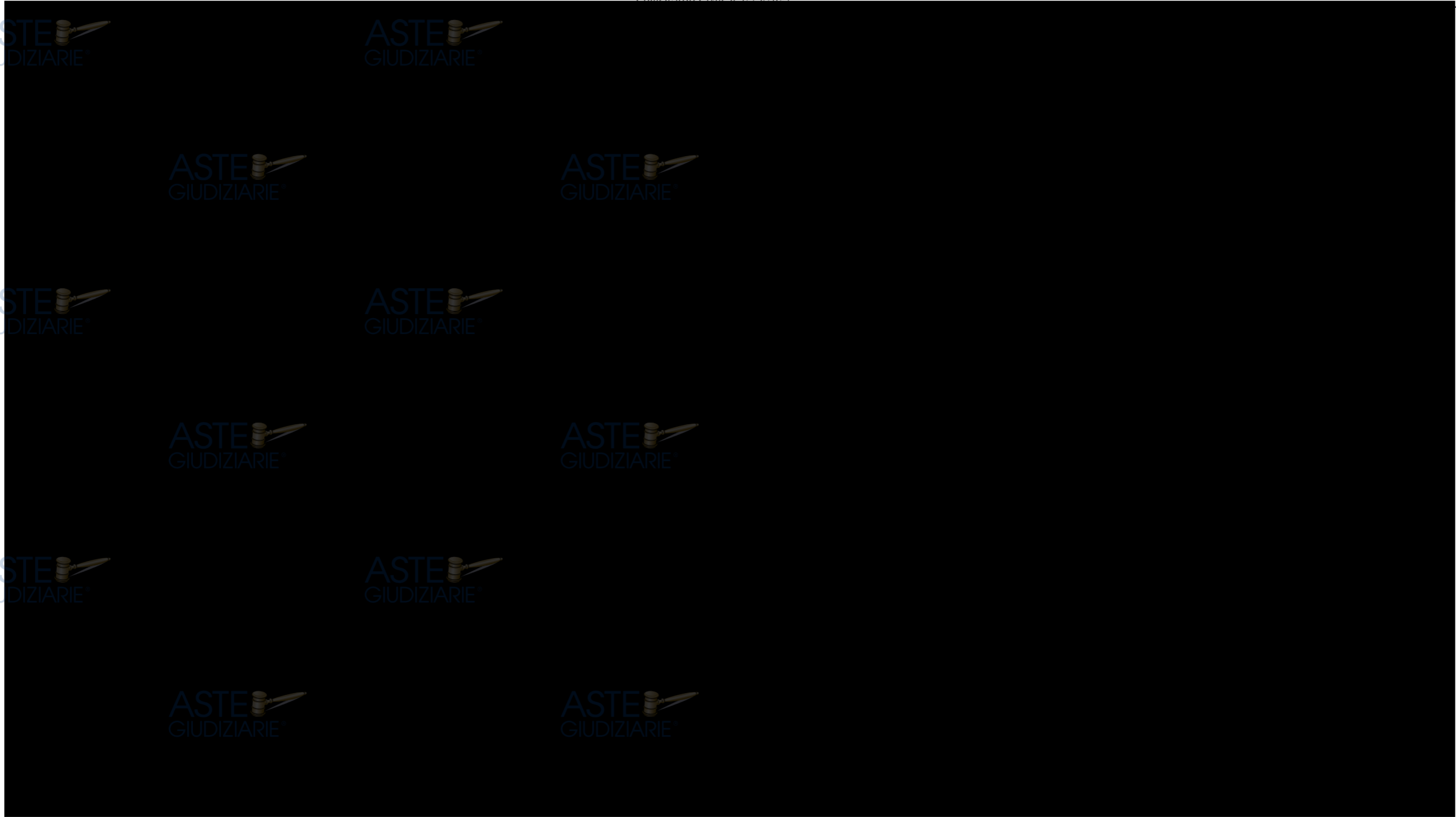
Figura 1: Cronistoria degli intestatari dell'immobile