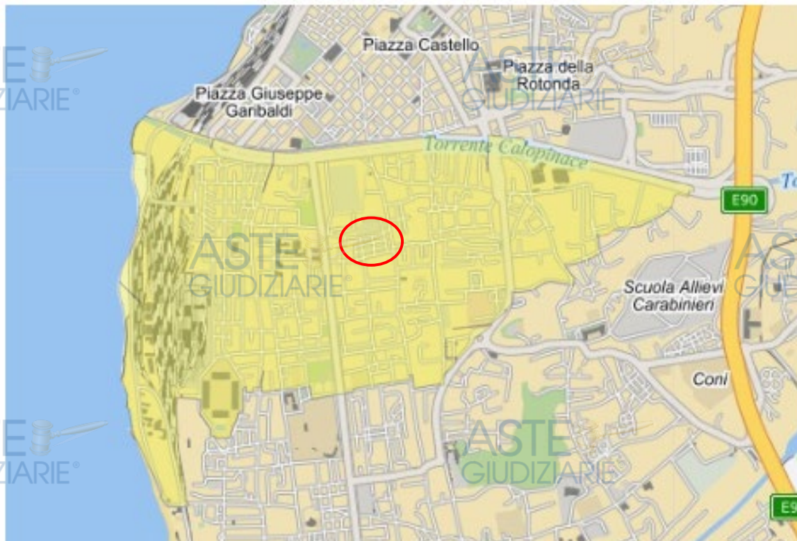
Figura 6: Individuazione della zona OMI in cui si trova l'immobile oggetto di pignoramento