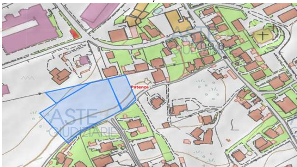
Terreno in Potenza Via Gronchi NCT foglio 75 part. 1959, 756, 757

(Vedasi Allegato 6 - documentazione ufficio tecnico)