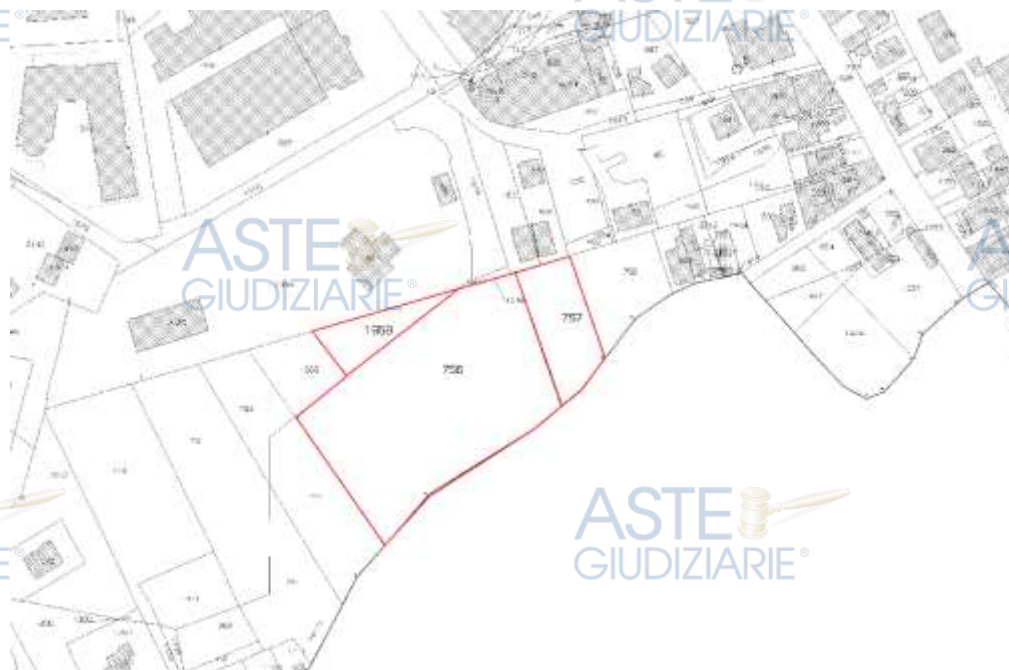
Terreno in Potenza Via Gronchi NCT foglio 75 part. 1959, 756, 757

(Allegato 4 - Visure Storiche e Allegato 2 -Mappe e Planimetrie Catastali)