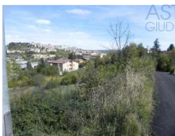
Terreno in Potenza Via Gronchi NCT foglio 75 part. 1959, 756, 757