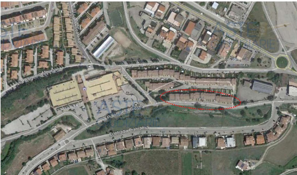
Foto Aerea - Cerchiato il complesso in cui ricadono i beni in oggetto

La fabbrica oggetto di stima fa parte di un lungo complesso a schiera che si dispone sul terreno pressoché pianeggiante del contesto ad una quota di ca. 515 mt. s.l.m.. L'area è caratterizzata dalla contiguità fisica con il "Borgo Brunelleschi" (centro commerciale di grandi dimensioni e punto di riferimento per l'intera comunità melfitana), con l'Ufficio delle Entrate e con la "Parrocchia Santa Giovanna Beretta Molla" che grazie alle sue strutture di aggregazione, d'intrattenimento e sportive risulta il luogo d'incontro e di riferimento per tutto il nuovo insediamento residenziale.