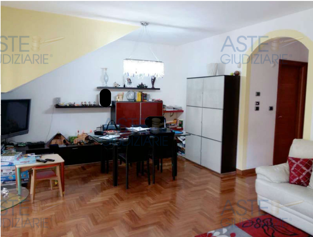
Foto del soggiorno

Di seguito si allegano le fotografie dell'unità immobiliare in di proprietà dei sig.ri [REDACTED]