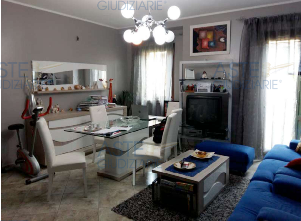
Foto del soggiorno

Di seguito si allegano le fotografie dell'unità immobiliare in di proprietà dei sig.ri [REDACTED]