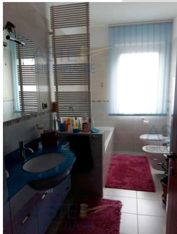
Foto della Cameretta e del Bagno