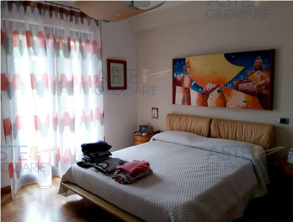
Foto della stanza da letto matrimoniale

Come è stato rilevato dai sopralluoghi e come parzialmente palesabile dalla documentazione fotografica sin qui esposta, gli appartamenti in oggetto sono in buono stato di manutenzione con rifiniture di ottima qualità sia estetica che funzionale. Lo stesso dicasi per gli impianti (la cui certificazione di conformità è attestata dal Certificato di Agibilità n. 82/2007 del 28/12/2007 rilasciato per l'intero complesso edilizio) e per gli infissi in legno con vetro camera, si segnala comunque la non reperibilità dell'Attestato di Prestazione Energetica delle due unità immobiliari abitative il cui costo per l'acquisizione per ogni unità immobiliare è di € 300,00 più oneri previdenziali e IVA..