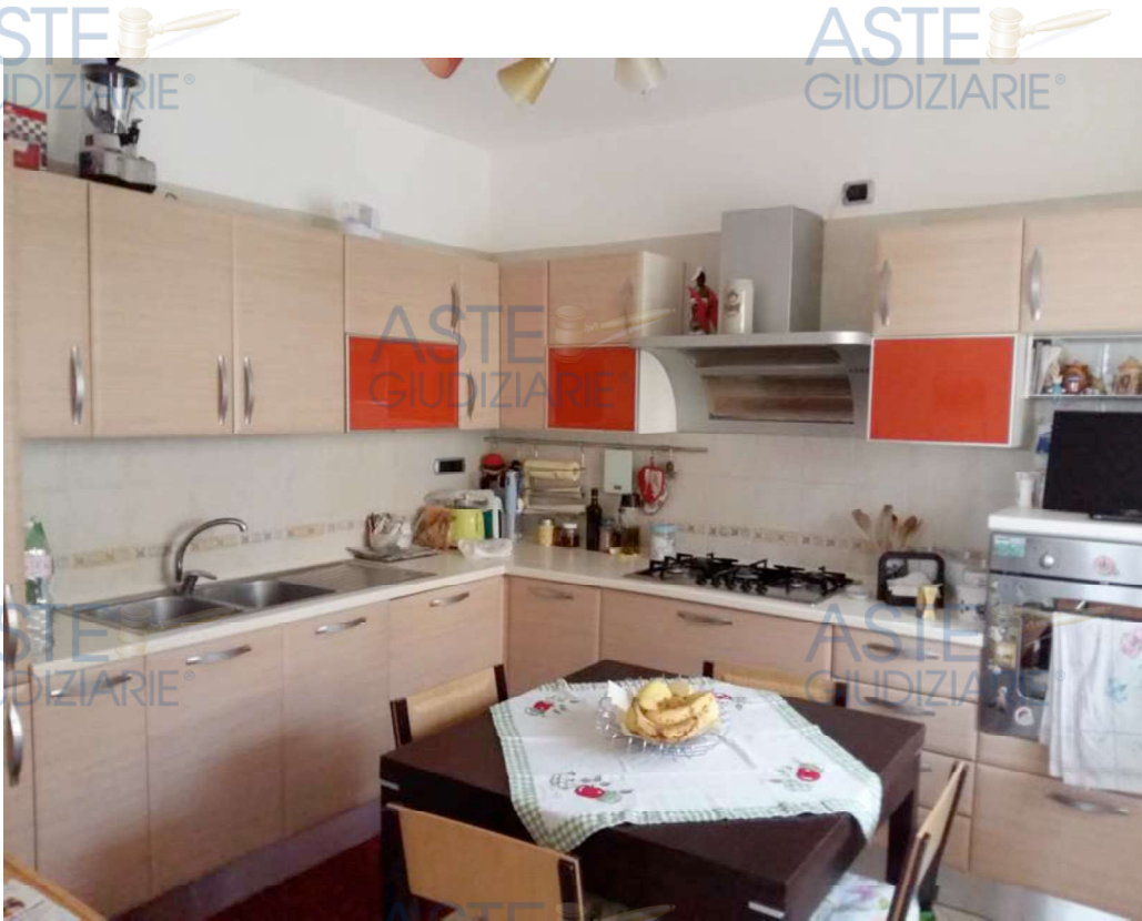
Foto della cucina