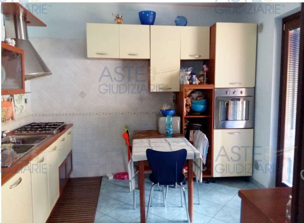
Foto della cucina