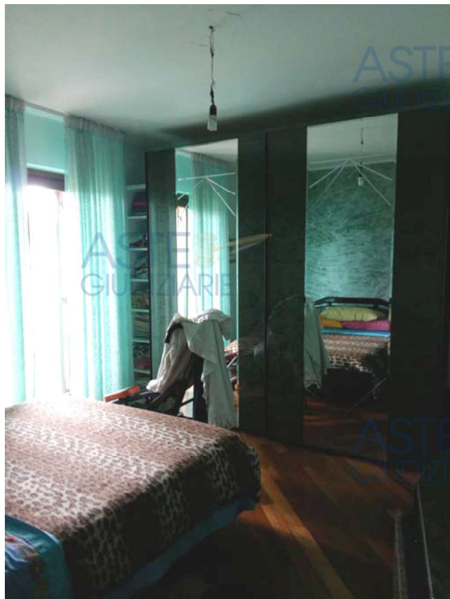
Foto della stanza da letto matrimoniale