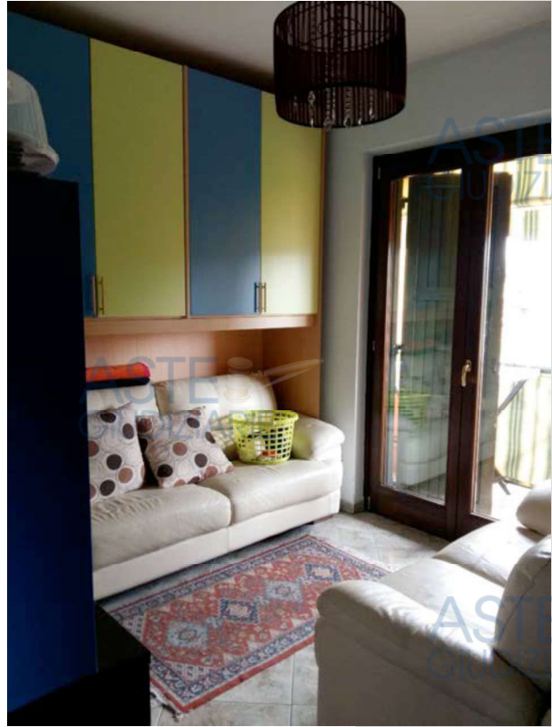
Foto del Bagno e della Cameretta