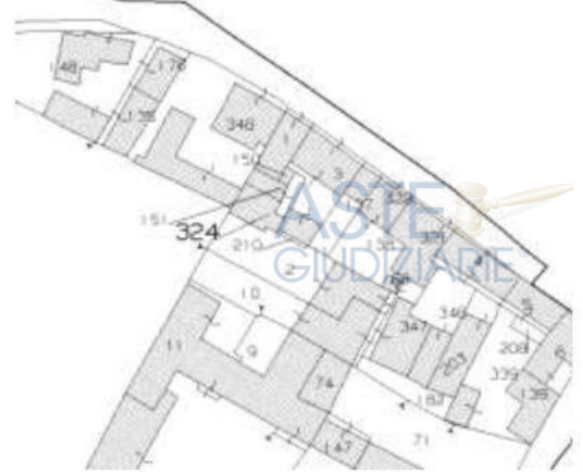
STRALCIO DELLA CARTOGRAFIA DI CATASTO TERRENI FOGLIO 12 IN COMUNE DI BORGO PRIOLO