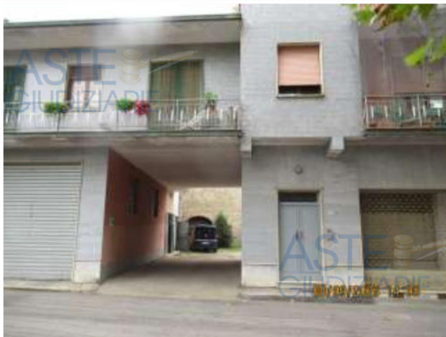
RIPRESA FOTOGRAFICA DELL'ANDRONE DA CUI SI ACCEDE E PROSEGUE NELL'AREA RETROSTANTE FINO A RAGGIUNGERE IL FABBRICATO OVE È SITUATA L'UNITÀ IMMOBILIARE.