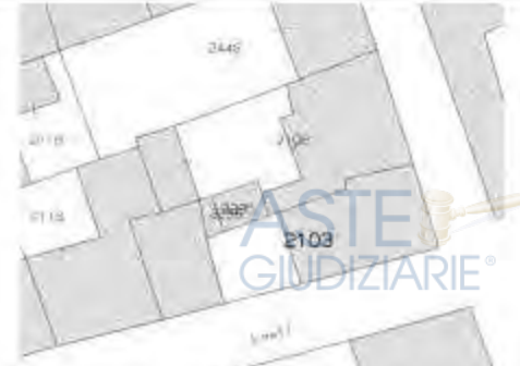
STRALCIO DELLA CARTOGRAFIA DI CATASTO TERRENI FOGLIO 17 IN COMUNE DI MORTARA