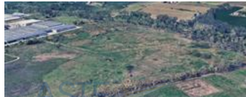
immagine tridimensionale (da est a ovest)