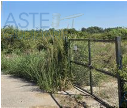
particolare cancello strada di accesso mezzi