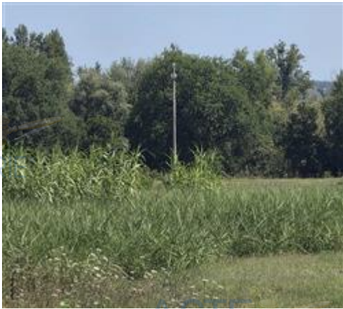
vista generale direzione Fiume Foglia