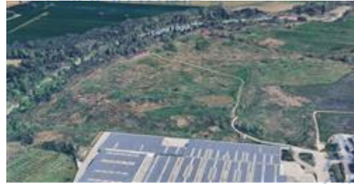
immagine tridimensionale (da ovest verso est)