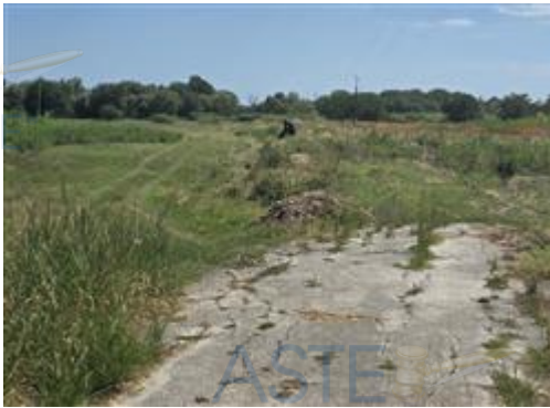
veduta verso est