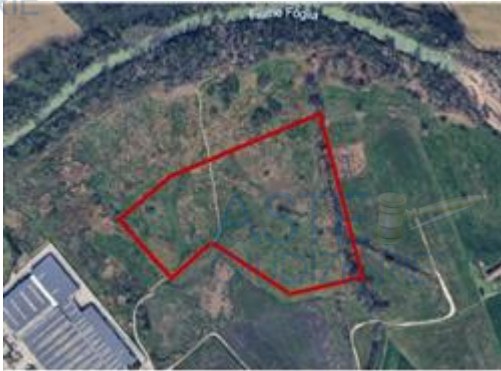
immagine aerea con individuazione del lotto complessivo