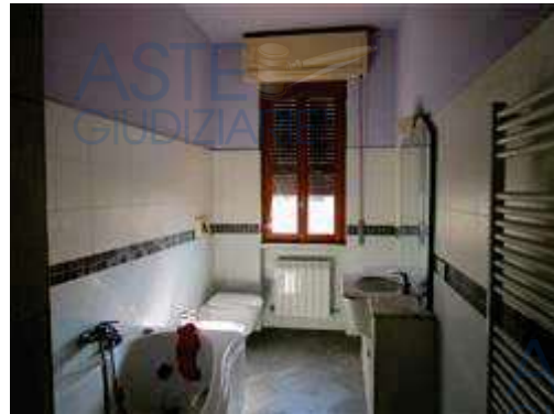
vista interna bagno grande