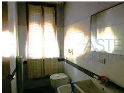
vista interna bagno piccolo realizzato nel ripostiglio