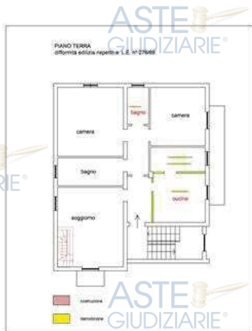
PT difformità edilizia