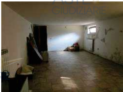
vista interna autorimessa