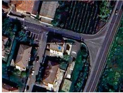
vista dell'immobile oggetto di perizia