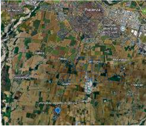
vista aerea della zona