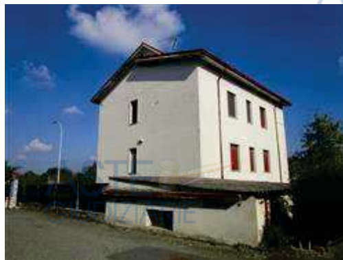
vista esterna del fabbricato lato sud ovest