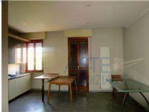
vista interna cucina