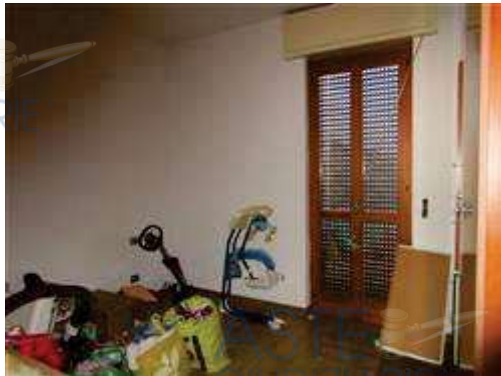
vista interna camera matrimoniale