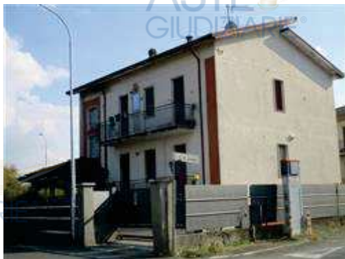
vista esterna della facciata principale lato nord

L'intero edificio sviluppa 3 piani, 2 piani fuori terra, 1 piano interrato. Immobile costruito nel 1971.