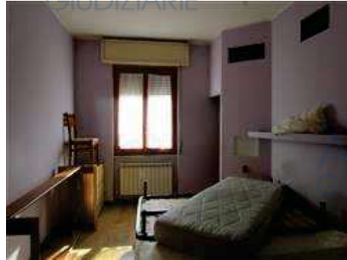
vista interna camera da letto