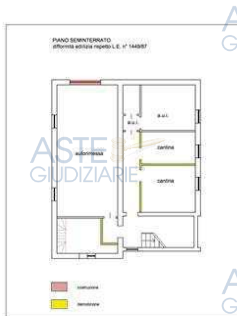
PS difformità edilizia