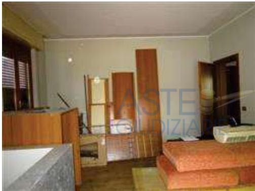
vista interna soggiorno