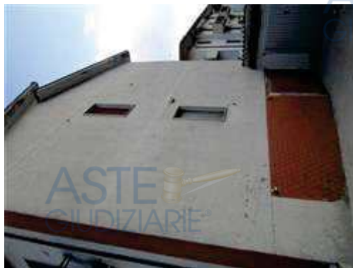
vista esterna con ingresso murato