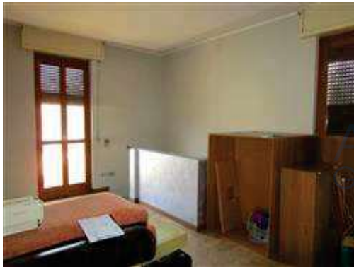
particolare della scala di collegamento ,non autorizzata, soggiorno e cantina