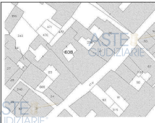
➤ Allegato 3: Estratto di mappa