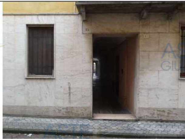
Accesso pedonale da Via Matteotti n. 15