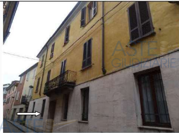
Accesso pedonale da Via Matteotti n. 15

Le unità immobiliari in oggetto costituiscono parte di un fabbricato condominiale con accesso pedonale da via Matteotti n. 15. L'abitazione è accessibile dal corpo scale posto a sud mentre la cantina risulta accessibile tramite un corpo scale posto a nord