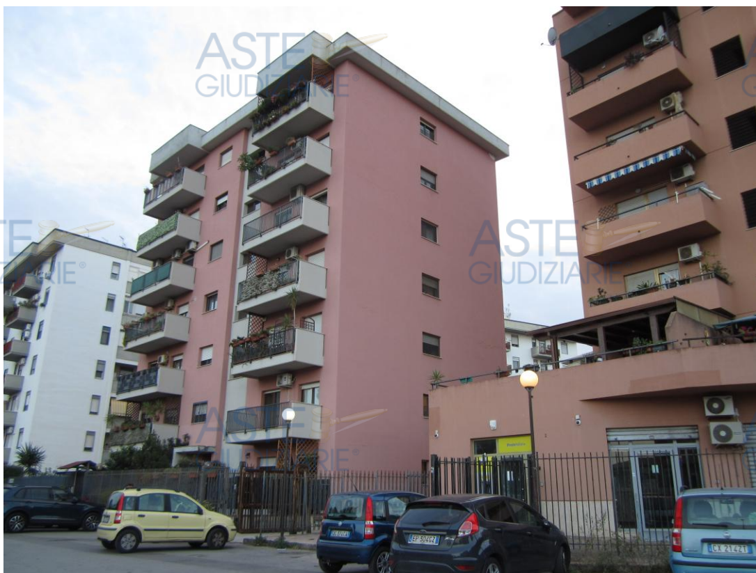
Foto 1: panoramica di piazza Russia da cui si diparte la rampa che conduce al piano scantinato in cui è ubicato il locale box identificato nel fg. 40 di Palermo dalla p.lla 2647 sub. 30