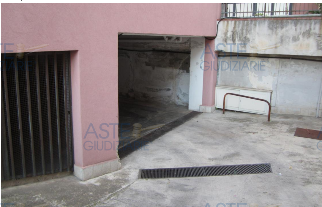
Foto 3: lo sbarco della rampa da cui si raggiunge la corsia di manovra da cui si accede al locale box identificato nel fg. 40 di Palermo dalla p.lla 2647 sub. 30