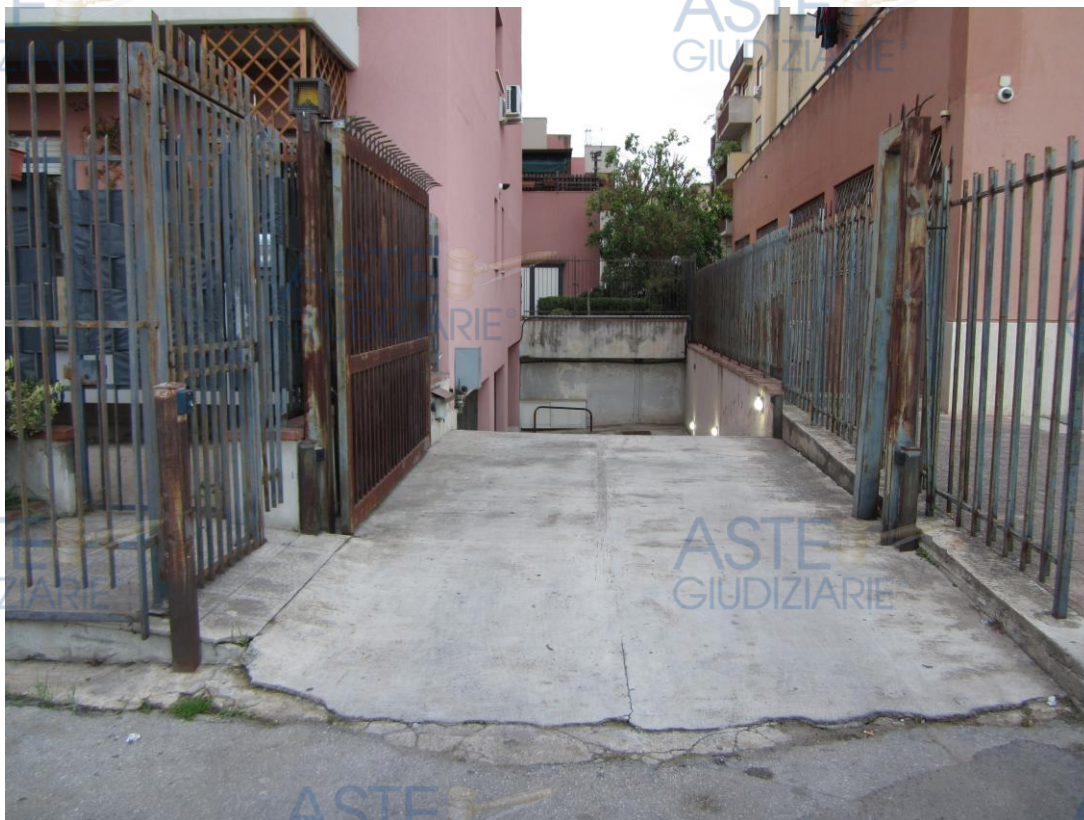
Foto 2: il cancello metallico che si apre su piazza Russia, oltre il quale si diparte la rampa che conduce al piano scantinato nel quale è ubicato il locale box identificato nel fg. 40 di Palermo dalla p.lla 2647 sub. 30