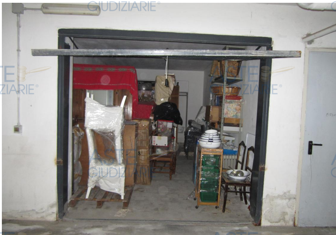
Foto 5: panoramica interna del locale box alla data del primo accesso (i beni mobili sono stati successivamente rimossi e oggi il locale è libero e disponibile al mercato)