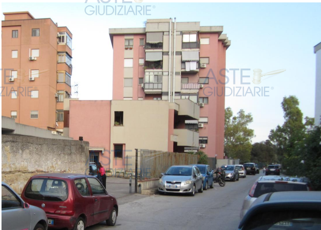
Foto 1: il cancello scorrevole attraverso il quale si accede alla corte comune (identificata nel fg. 40 di Palermo dal b.c.n.c. 2647 sub. 1) che consente di raggiungere il posto auto scoperto identificato nel fg. 40 di Palermo dalla p.lla 2647 sub. 8