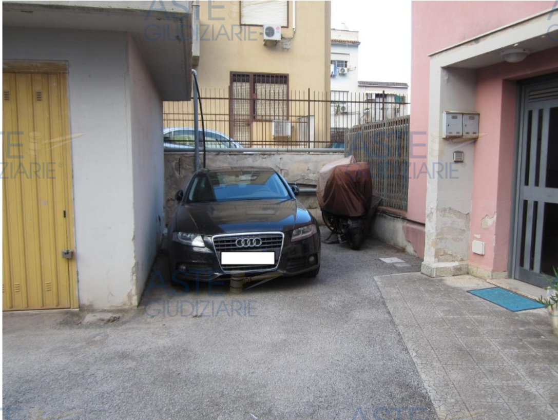
Foto 2: il posto auto scoperto identificato nel fg. 40 di Palermo dalla p.lla 2647 sub. 8, confinante di fronte con la corte comune (bene comune non censibile identificato dalla p.lla 1647 sub. 1), a sinistra con il locale box identificato dalla p.lla 2647 sub. 40 e sulla destra con l'attinenza esclusiva identificata dalla p.lla 2647 sub. 12

Planimetria di rilievo dello stato reale dei luoghi (il rilievo è risultato coerente con la planimetria catastale riportata di seguito)