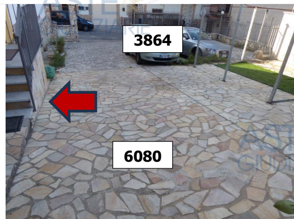
Foto n. 2 – ingresso all'appartamento LOTTO 5 su porzione della particella 6080

Ai fini della procedura che ci interessa appare pertanto opportuno evidenziare quanto riportato al paragrafo DISPOSIZIONI COMUNI dell'atto di provenienza del bene oggetto di pignoramento, sub LOTTO 4 : a pag. 4, rigo 2 e segg. dell'atto di VENDITE del 02/02/2004, rep./racc.