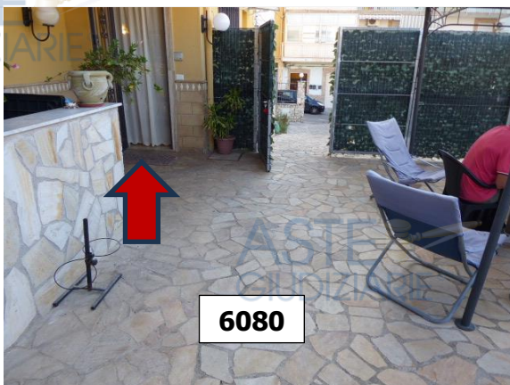
Foto n. 1 – ingresso all'appartamento LOTTO 4 su porzione della particella 6080