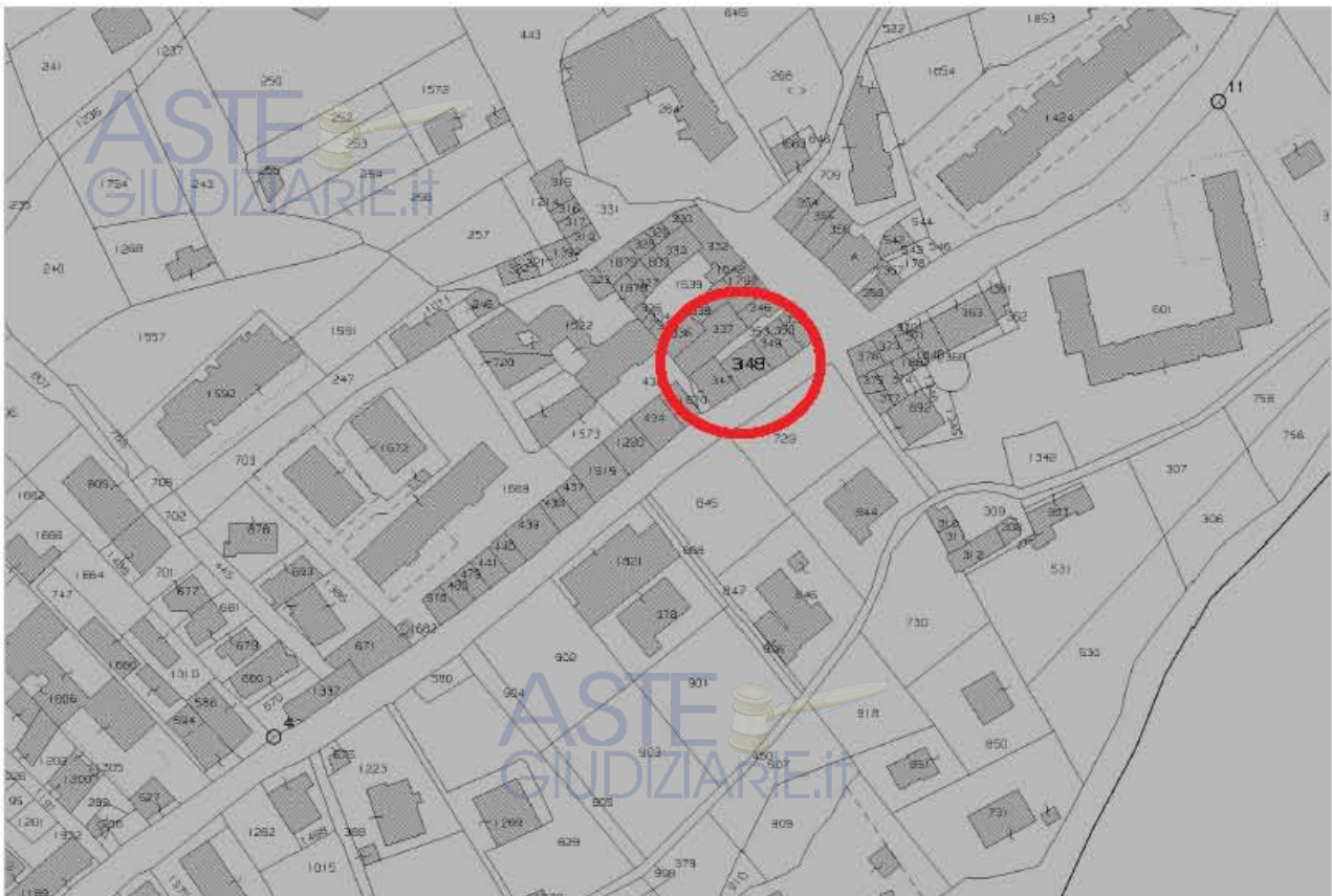
Immagine n. 2 – Estratto mappa catastale

ed un secondo (accertamento catastale) mirato all'acquisizione della planimetria catastale del bene (si veda la successiva immagine n. 5).