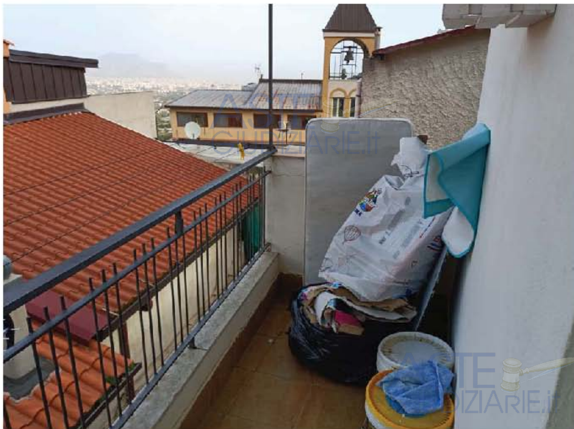
Immagine n. 15 – Vista del ballatoio prospiciente il cortile