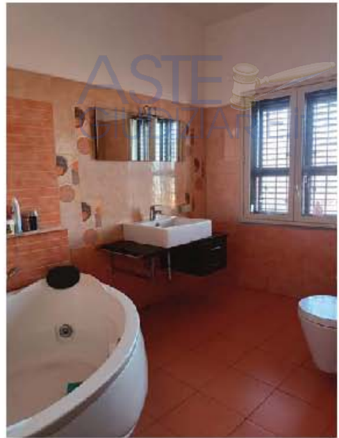
Immagine n. 10 – Vista del bagno