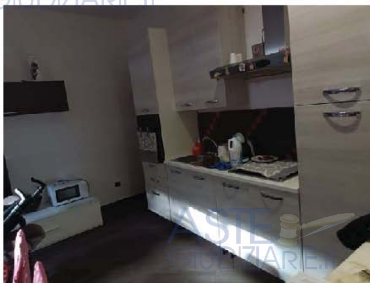
Immagine n. 8 – Vista del soggiorno-cucina