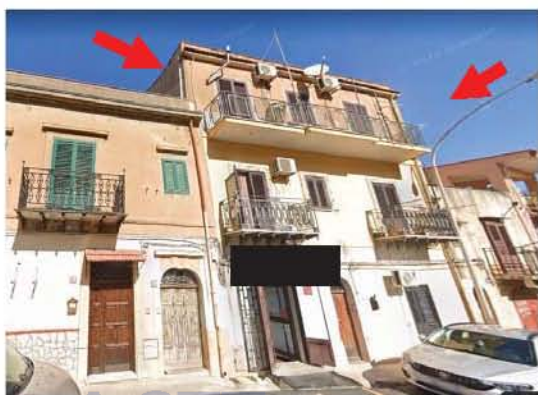
Immagine n. 3 – Vista dello stabile

Gli impianti, da una sommaria ricognizione visiva, risultavano essere rispondenti alla vigente normativa mentre l'Attestato di Prestazione Energetica fa parte integrante della compravendita (Allegato n. 10).