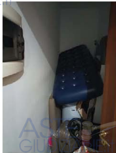
Immagine n. 12 – Vista del ripostiglio