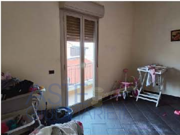
Immagine n. 13 – Vista della camera