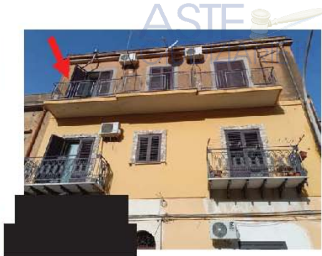
Immagine n. 14 – Vista del ballatoio su via Altofonte