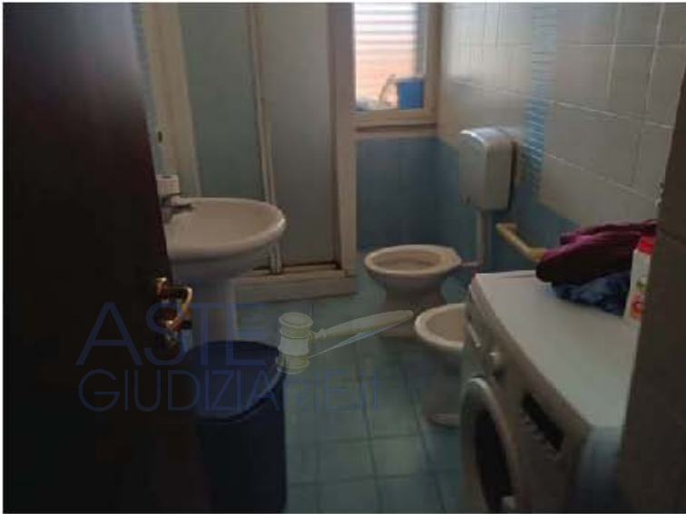
Immagine n. 9 – Vista del doppio servizio