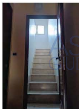
Immagine n. 4 – Vista del corpo scala