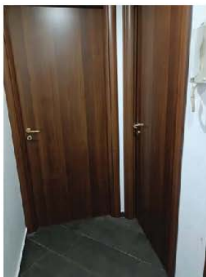
Immagine n. 7 – Vista del disimpegno