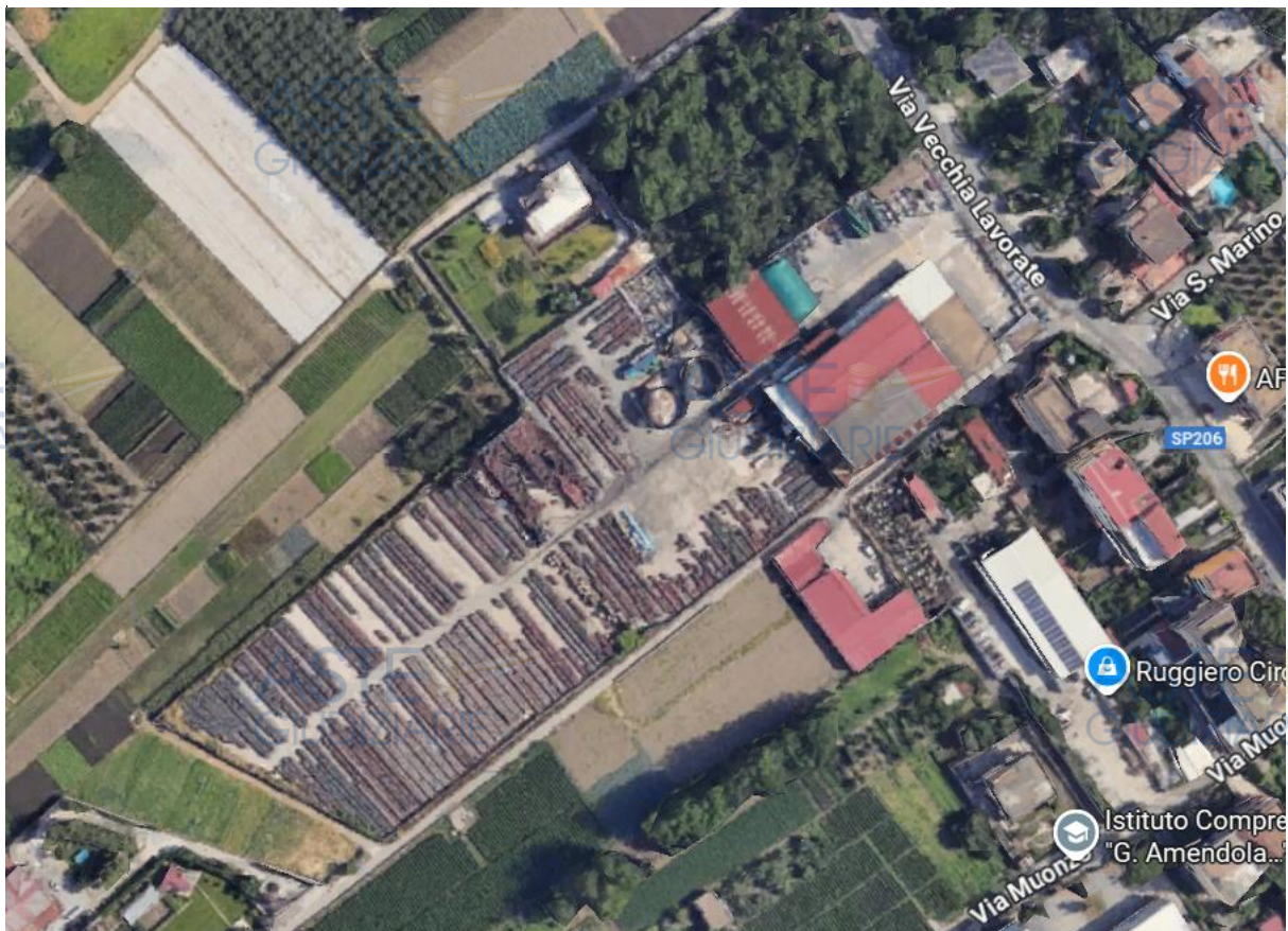
Foto 1: inquadramento satellitare con indicazione degli immobili oggetto di valutazione.

Si riportano a seguire delle rappresentazioni su ortofoto confrontate con mappe catastali elaborate dalla SOGEI.