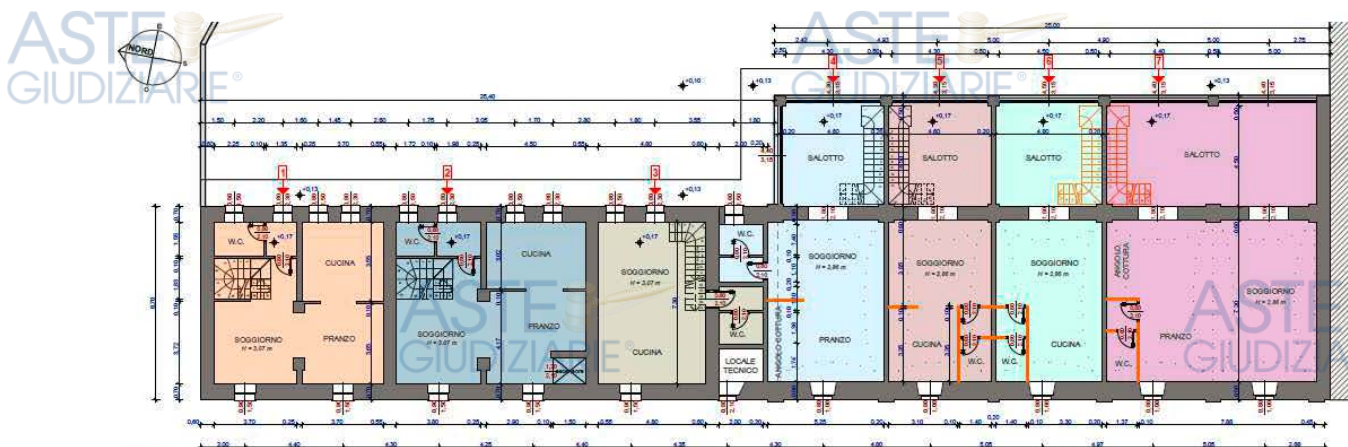
Estratto Tav. 1 SCIA di completamento opere - Prot. 2016-15041 del 07/10/2016 – Piano terra