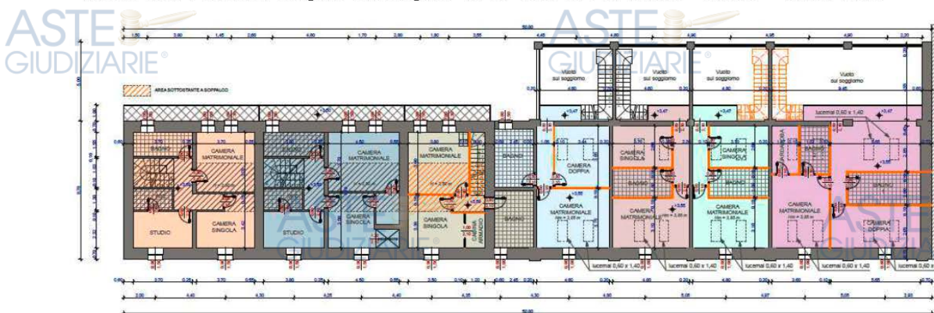
Estratto Tav. 1 SCIA di completamento opere - Prot. 2016-15041 del 07/10/2016 – Piano primo

Le superfici equivalenti, calcolo presente all'interno della relazione di ogni unità commerciale, più comunemente definite superfici commerciali, includono non solo le superficie calpestabili, ma anche gli elementi accessori come i muri, oppure di balconi, cantine e altri spazi, rendendoli sempre una misura completa utile per il valore venale, utilizzando coefficienti di destinazione che correggono la superficie degli accessori.