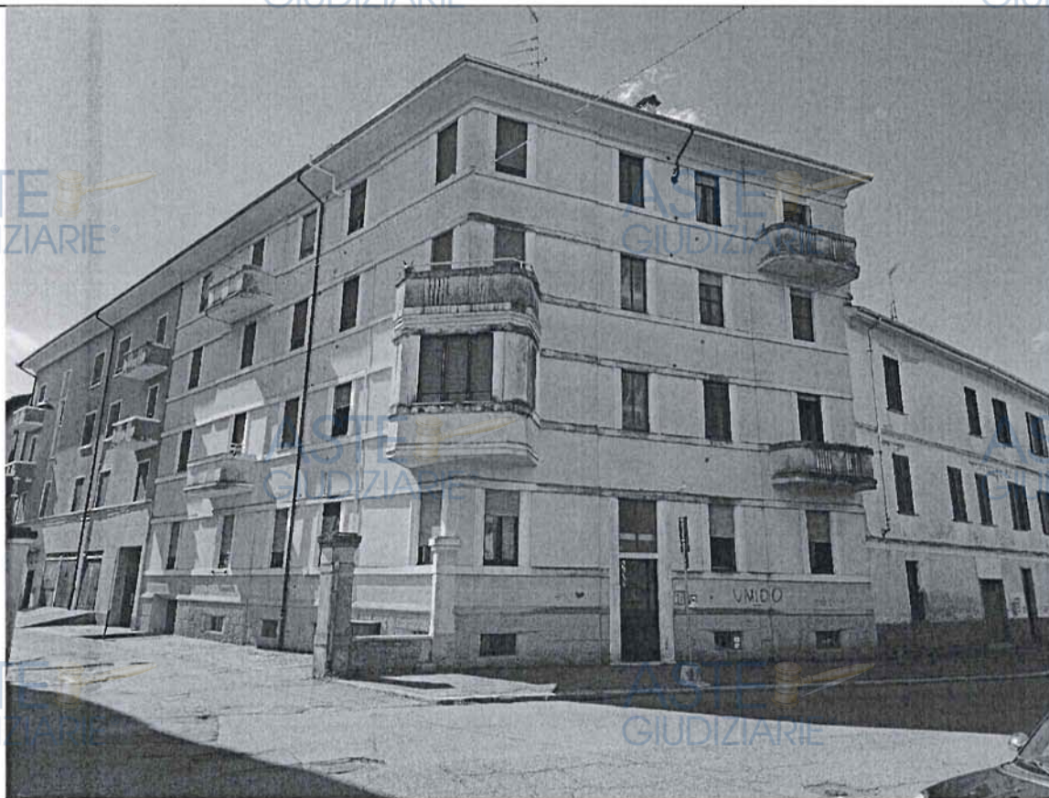
Vista esterna: ingresso dalla pubblica viabilità, Via Giovanni Biroli 3/C