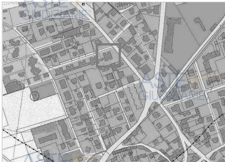
Estratto P.R.G.C. (non in scala)

L'immobile insiste su un'area interna alla perimetrazione urbana e su di essa non insistono specifici vincoli.