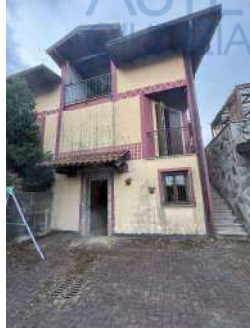
Vista Esterna 1