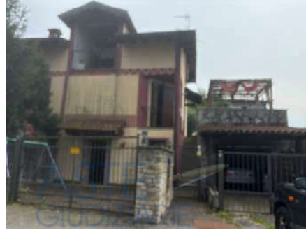
Vista Esterna 2

Abitazione sita nel Comune di Divignano, Via Schiappina n. 6, posta su tre piani, composta al piano interrato (primo entro terra) da: taverna e lavanderia/centrale termica e autorimessa separata; al piano terra (primo fuori terra) da: cucina, soggiorno, disimpegno, una camera, bagno, balcone e portico, cortile e giardino privati; Al piano primo/sottotetto (secondo fuori terra) da: due stanze, disimpegno, bagno e terrazzo.