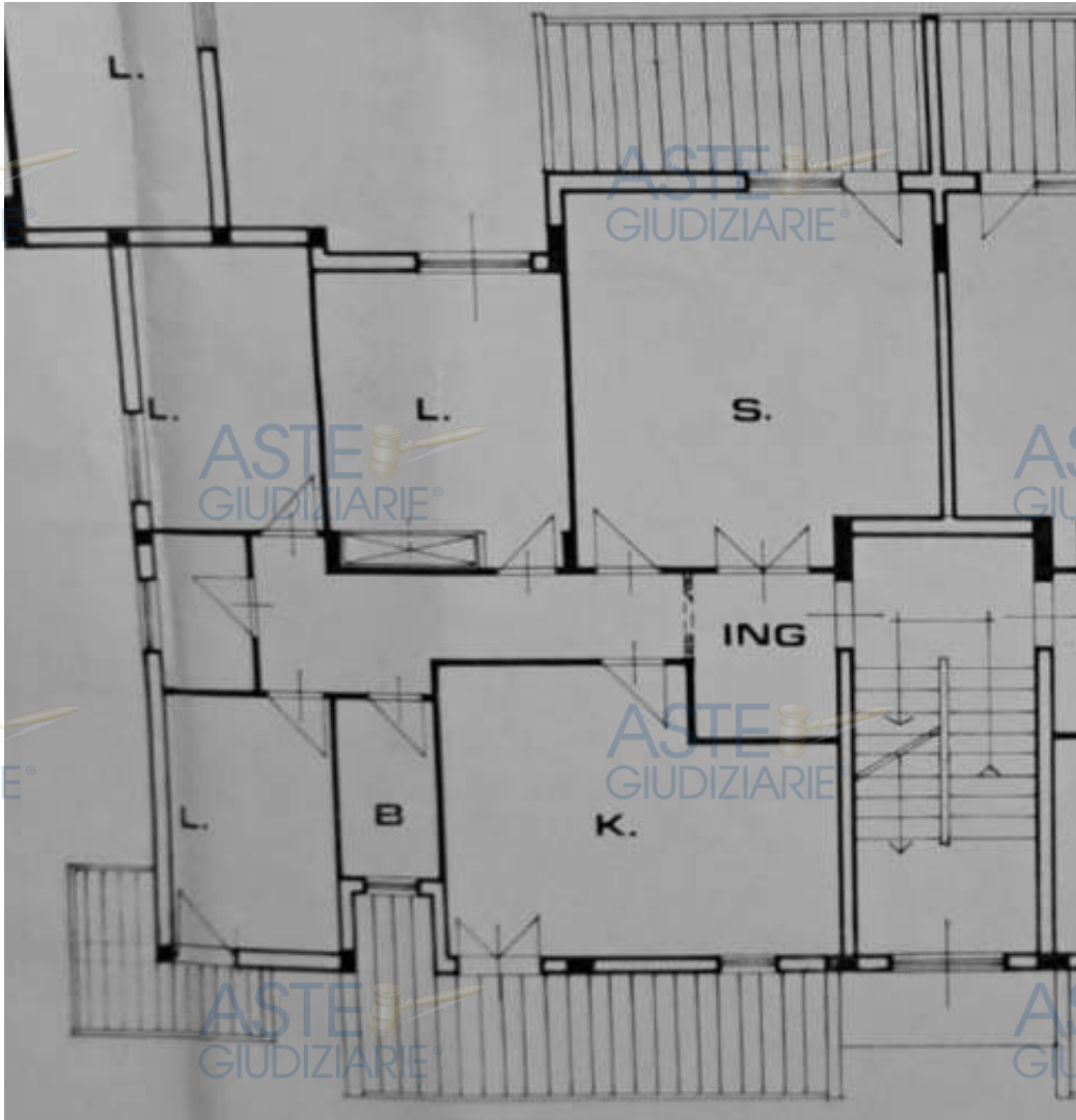
GRAFICO ALLEGATO ALLA C.E. in VARIANTE n.20/1983

Dal grafico sopra riportato, allegato alla C.E. in Variante n.20/1983 (ALLEGATO XIII), si evincono delle piccole difformità di perimetrazione rispetto allo stato reale dei fatti e rispetto alla planimetria catastale. Tali difformità risultano a tutt'oggi sanabili rispetto al D.P.R. n.380/2001 e ss.mm. e ii. (T.U. dell'Edilizia aggiornato).