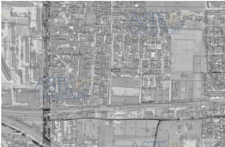
Foglio 6 - Particella 830 – NCEU di TEVEROLA (CE)

Il compendio immobiliare oggetto di pignoramento è situato nel Comune di TEVEROLA 81030 (CE) nel Super Condominio del "Parco Primavera" alla Via Roma, Sesta Traversa Il tratto, n.5 - 7. Per garantire l'esatta individuazione dell'edificio di seguito è stata allegata una sovrapposizione delle foto satellitari dell'area d'interesse e della relativa mappa catastale.