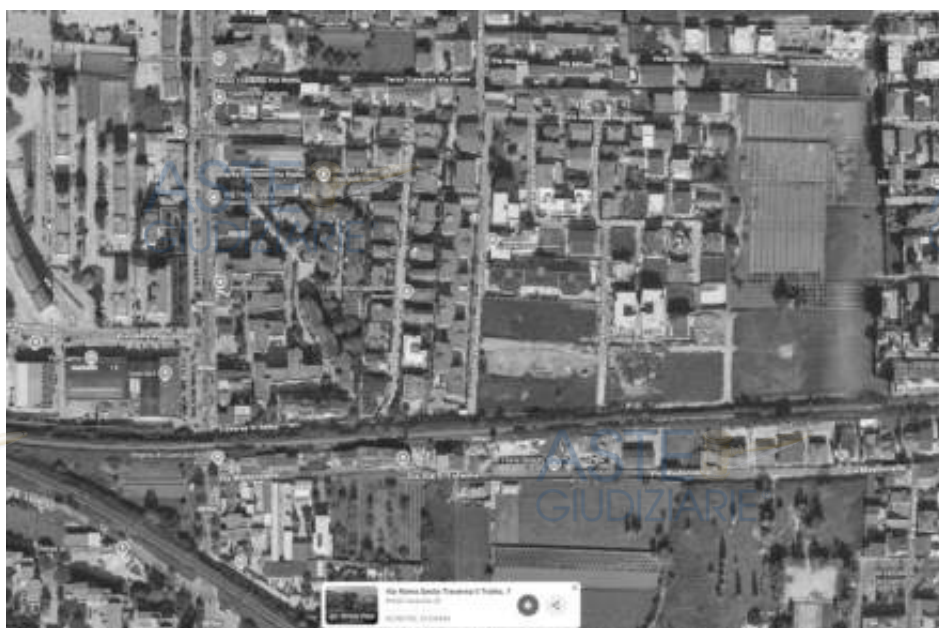
AEROFOTO – inquadramento immobile oggetto di pignoramento.