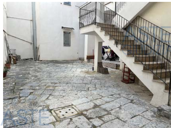
Vista della facciata principale del fabbricato di afferenza dell'unità e dettagli interni di androne e cortile

L'accesso al complesso avviene dall'attuale civico n. 11 di piazza Garibaldi, piccolo slargo allocato lungo lo sviluppo del centrale corso Vittorio Emanuele. Il portone di ingresso, oggetto di recenti lavori di manutenzione, immette in un androne coperto e, a seguire, nella corte interna, lastricata con basoli di piena naturale, da cui parte la scala che disimpegna i vari livelli del manufatto.