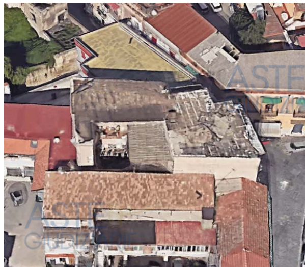
Vista aerea del contesto cui afferisce il manufatto di piazza Garibaldi n. 11, Villaricca (Na)

Il pignoramento, per una quota di 1/1 della piena proprietà, è stato effettuato in danno