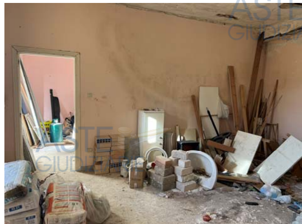
Dettagli interni dell'unità staggita