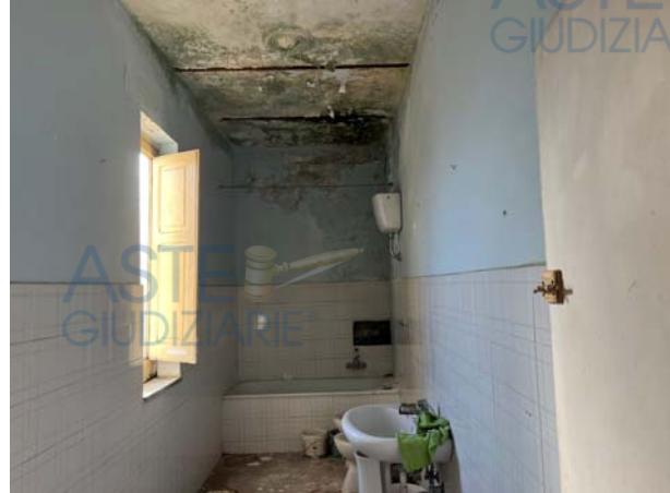
Dettagli interni dell'unità staggita