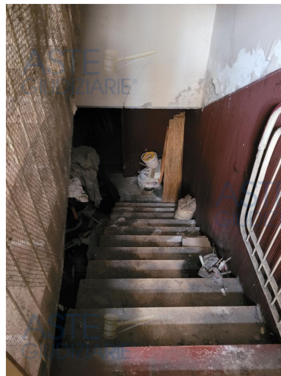
Vista scale di accesso al piano sottrada