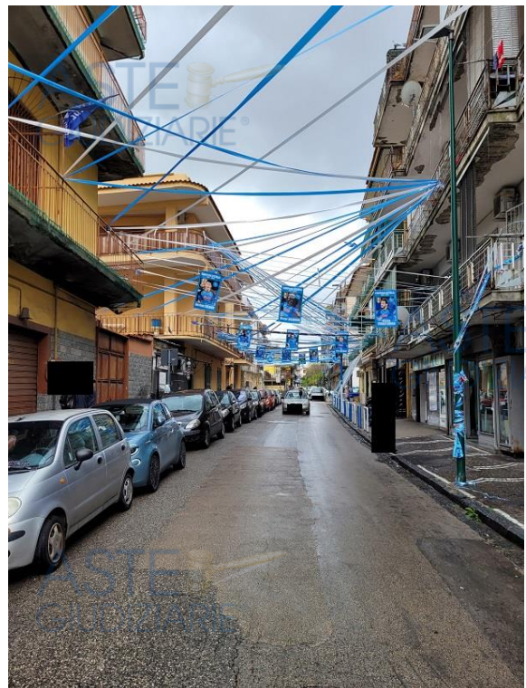
Vista 1° traversa di Via Vittorio Veneto