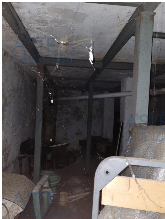
Vista locale deposito interrato