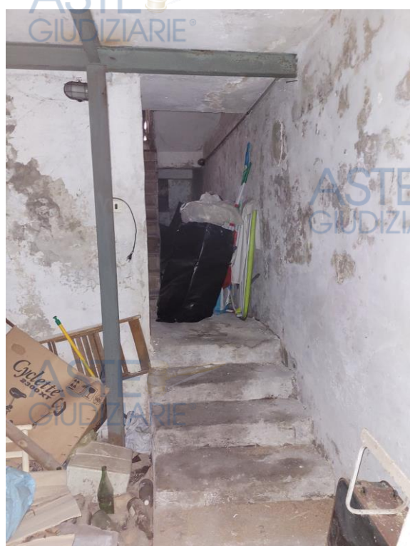
Vista locale deposito interrato