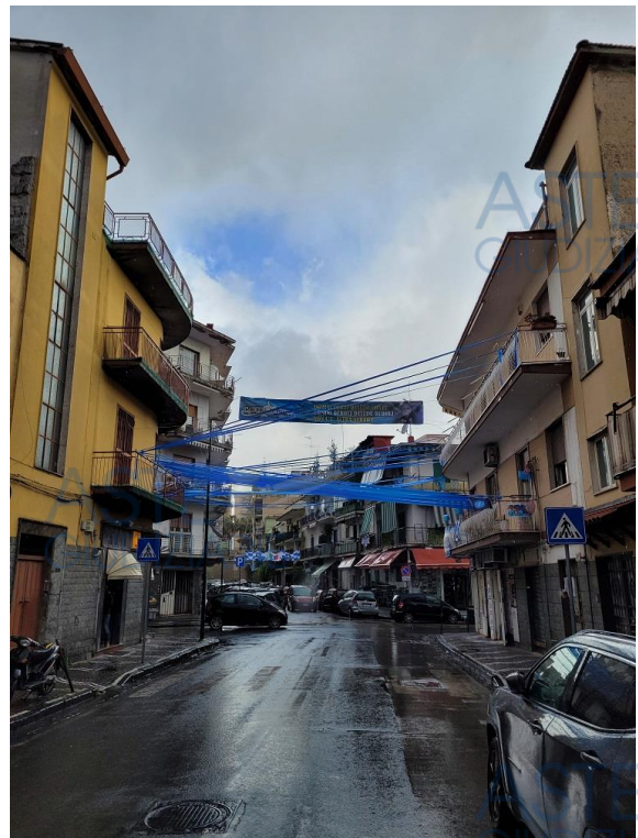
Vista di Via Vittorio Veneto