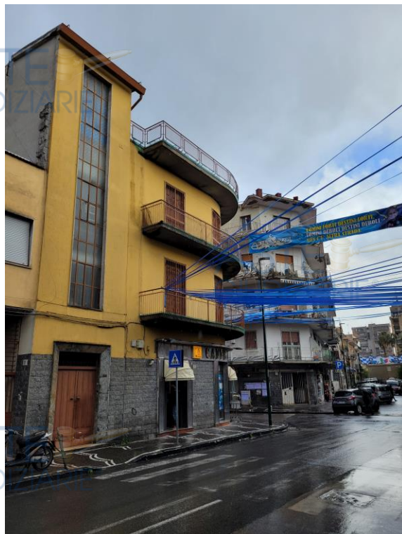
Vista immobile da Via Vittorio Veneto