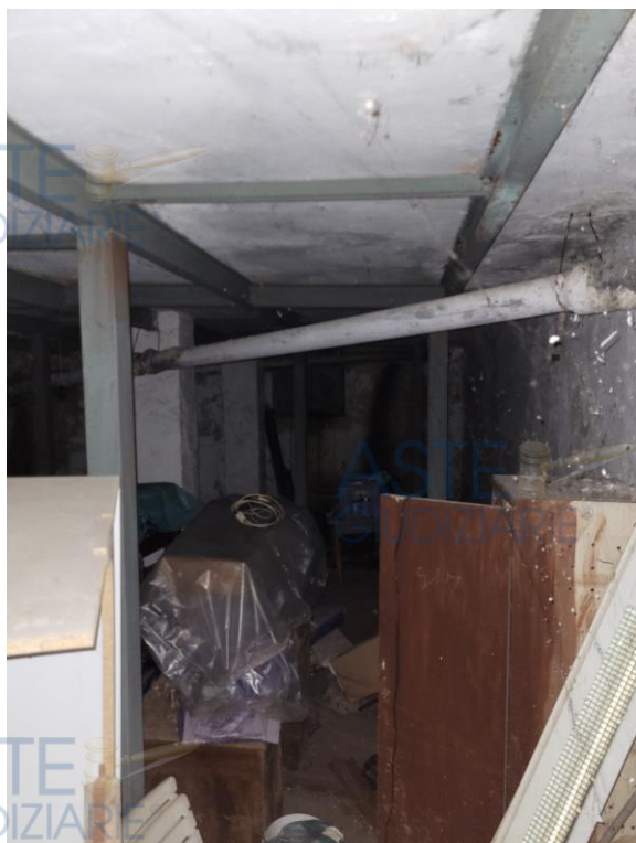
Vista locale deposito interrato