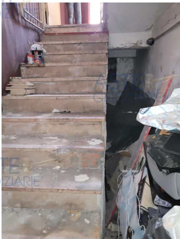
Vista ingresso del cespite