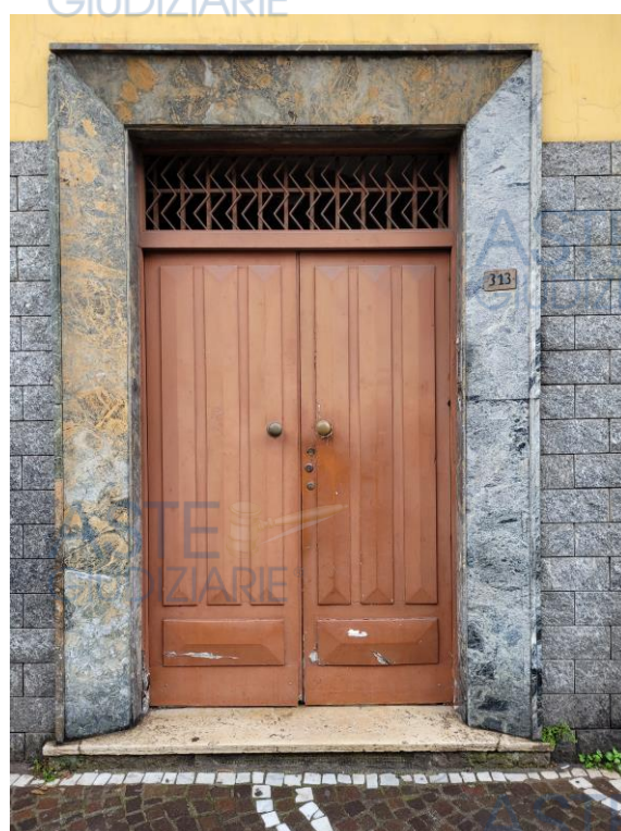
Vista portone di ingresso allo stabile