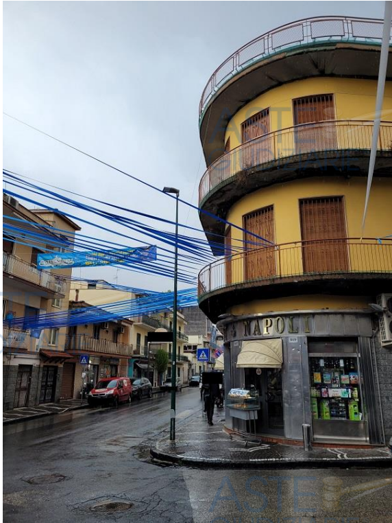
Vista da Via Vittorio Veneto