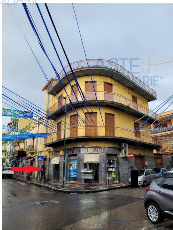
Individuazione vano di accesso allo stabile