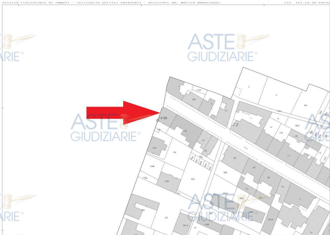
Estratto di mappa – COMUNE DI NAPOLI Foglio 16 p.la 55

Dalla sovrapposizione dello stralcio aerofotogrammetrico con la foto satellitare e con l'estratto di mappa il sottoscritto CTU può affermare che l'individuazione del bene oggetto di pignoramento è esattamente individuato.