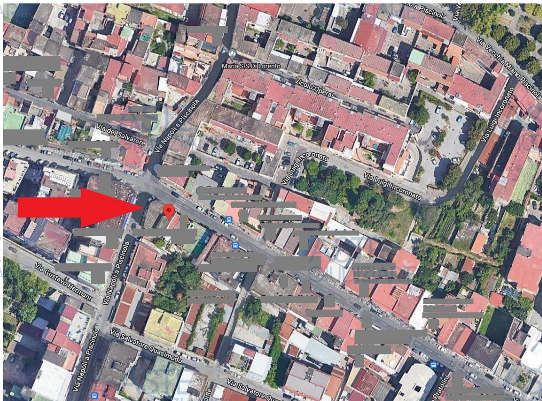
Foto aerea-satellitare con individuazione dell'edificio in cui è allocato il bene pignorato