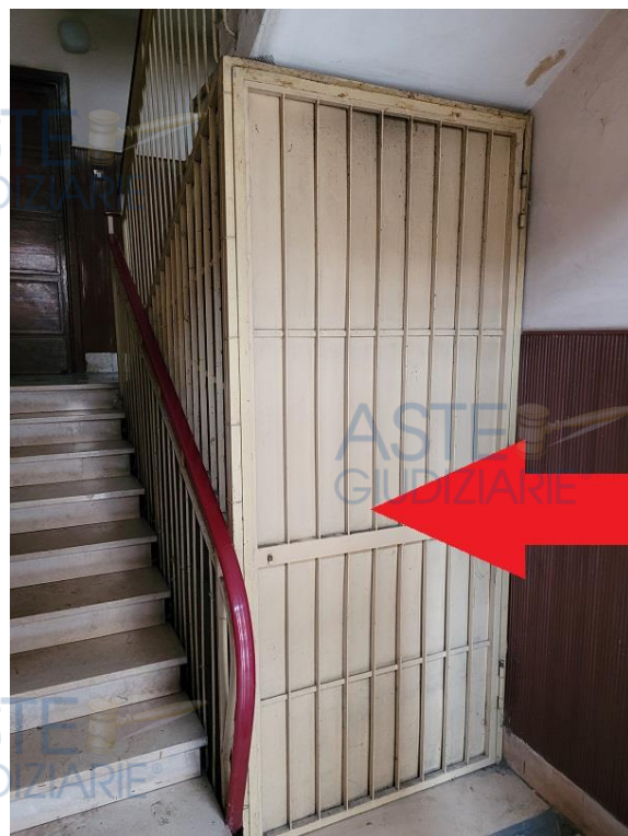
Vista cancello di ingresso allo stabile