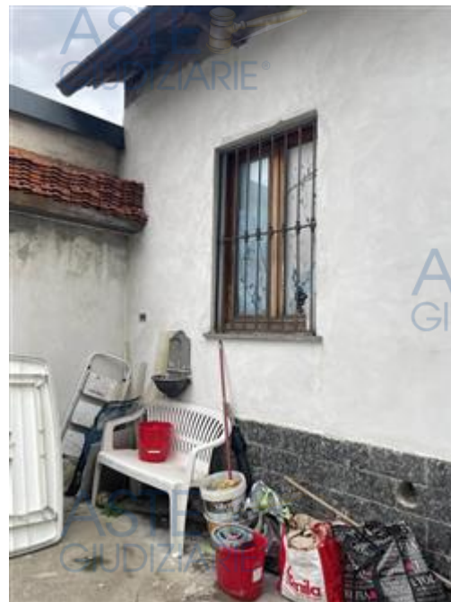
l'affaccio sul ballatoio comune