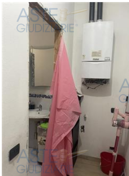
corridoio e ingresso bagno