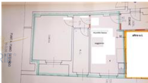
planimetria stato di fatto

Tempi necessari per la regolarizzazione: 60 giorni