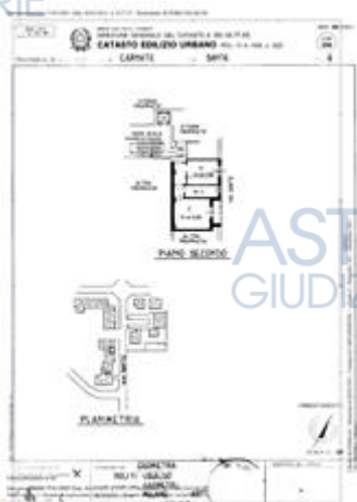
planimetria catastale depositata