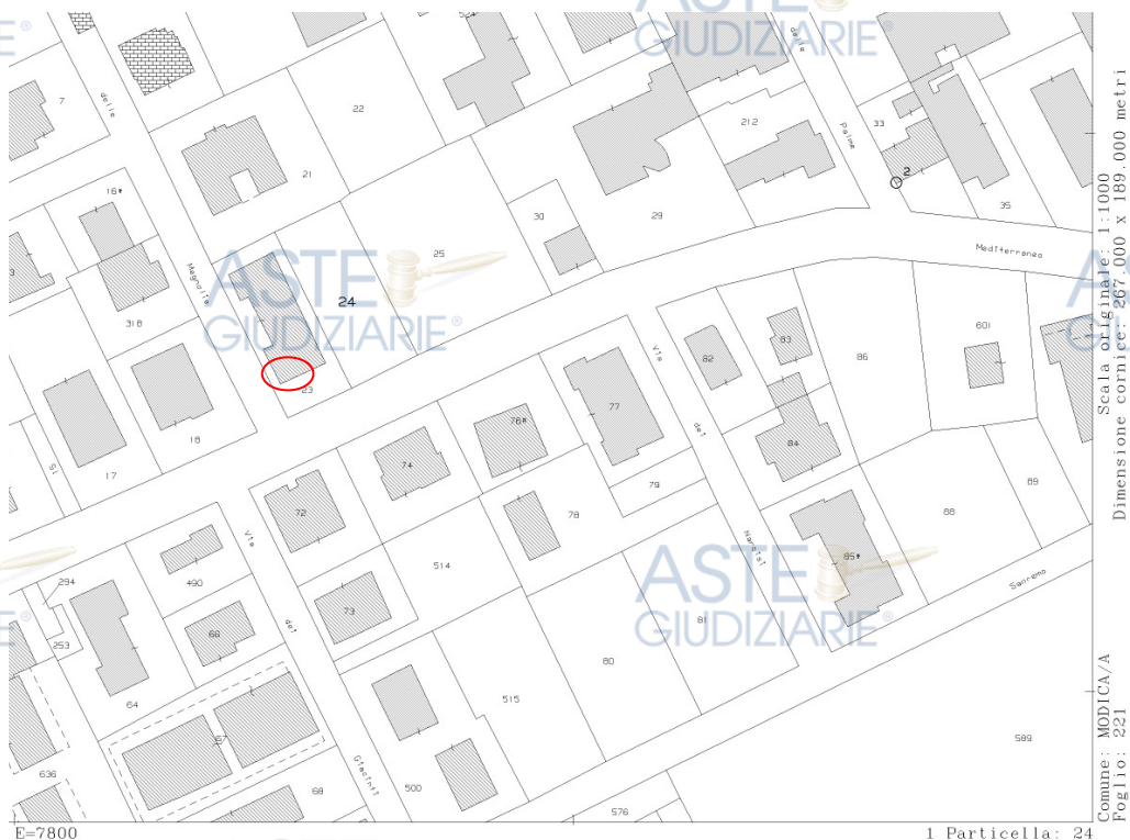
FIGURA 6: Estratto di Mappa Comune di Modica – Foglio 221 P.lla 24