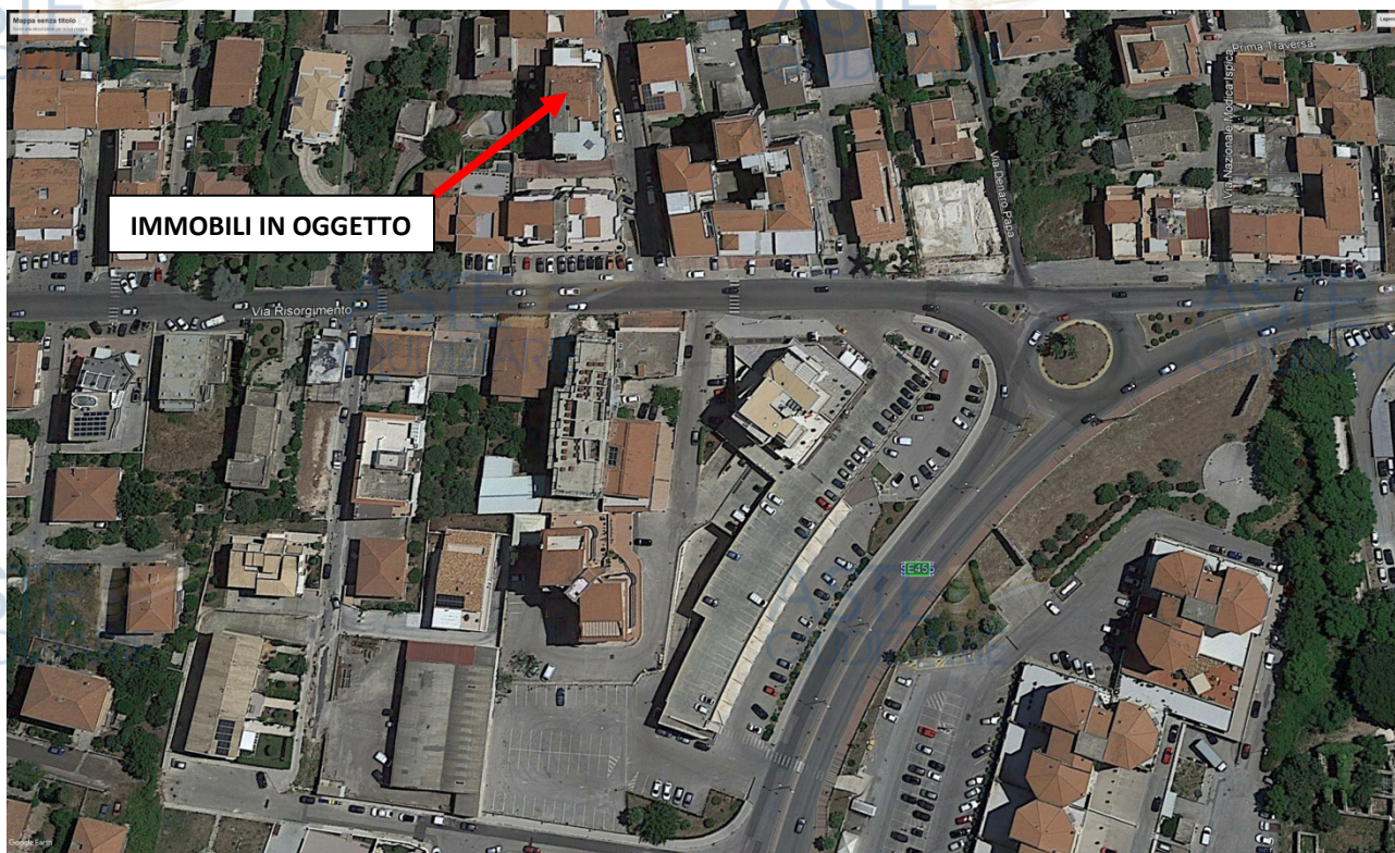
FIGURA 1: Immobili di via Risorgimento n. 231/A - Modica