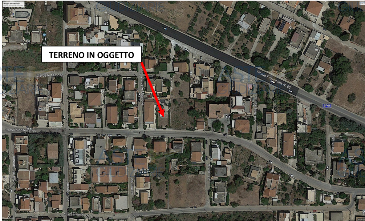
FIGURA 5: Terreno sito a Marina di Modica (fraz. di Modica) in corso Mediterraneo

Il terreno di cui sopra è ubicato a Marina di Modica (frazione di Modica) lungo il corso Mediterraneo (36° 42' 55.11" N – 14° 46' 49.60" E – 17 m s.l.m.). Trattasi di uno stacco di terreno raggiungibile percorrendo la S.P. 66 Pozzallo–Sampieri ed imboccando il corso Mediterraneo.