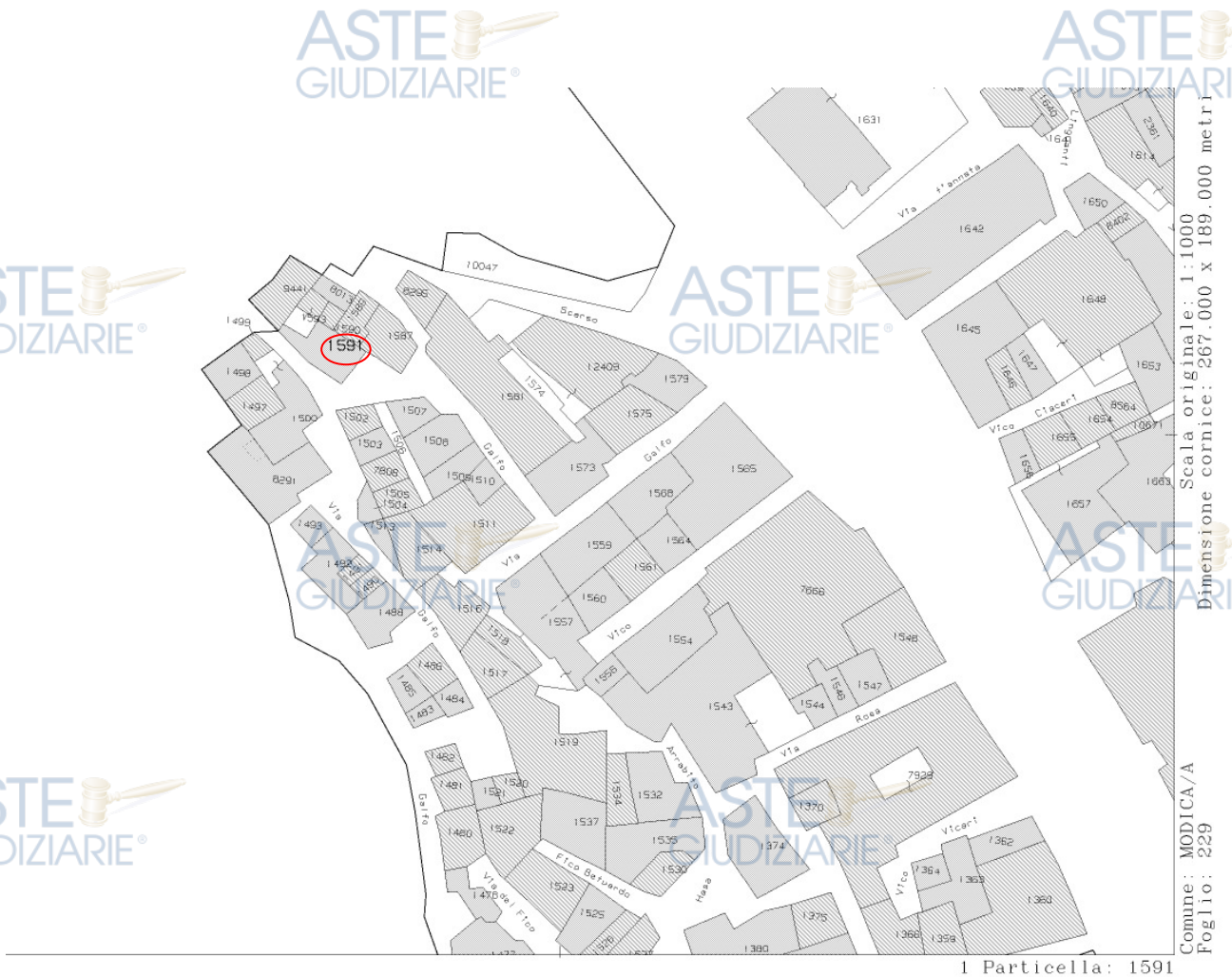
FIGURA 4: Estratto di Mappa Comune di Modica - Foglio 229 P.Ila 1591