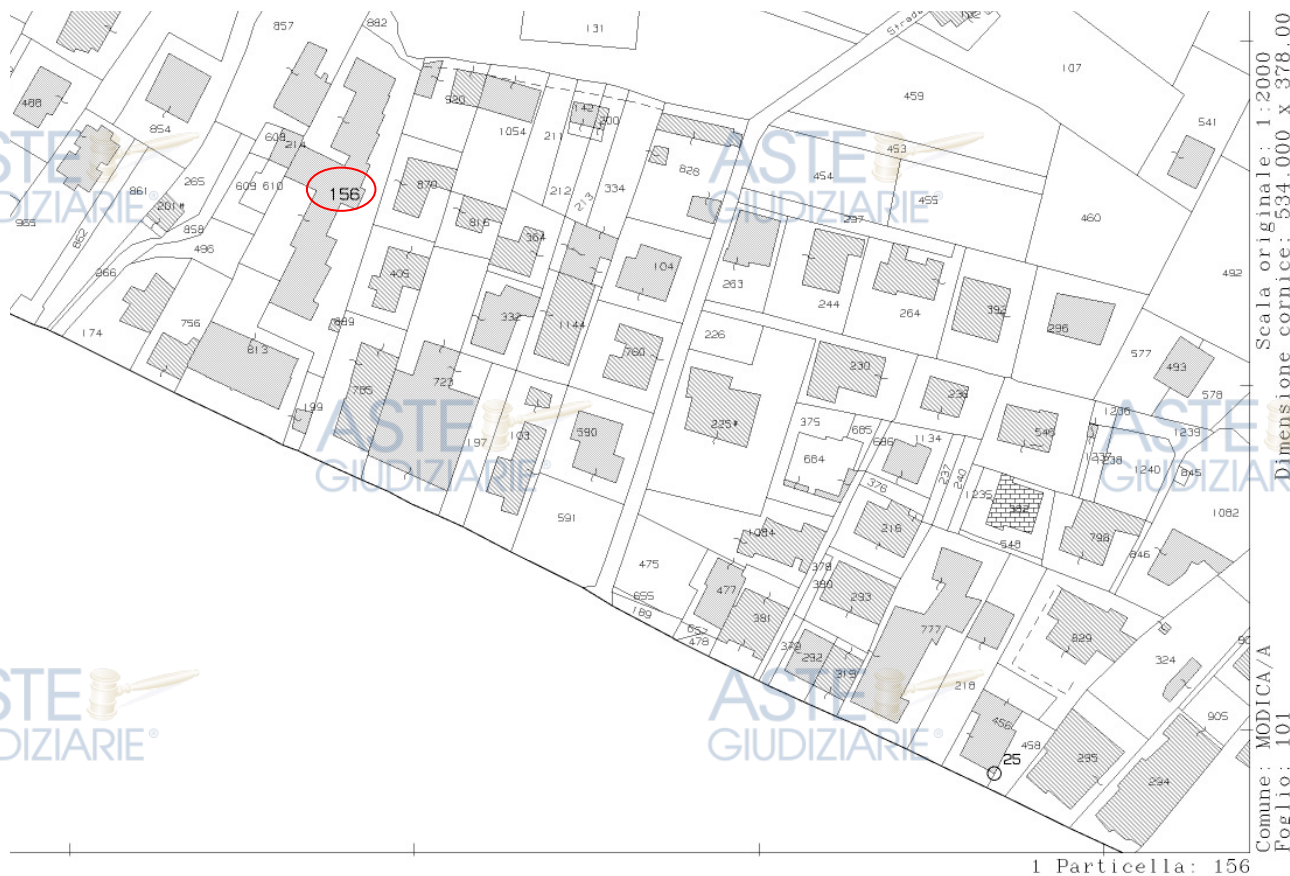
FIGURA 2: Estratto di Mappa Comune di Modica – Foglio 101 P.Illa 156