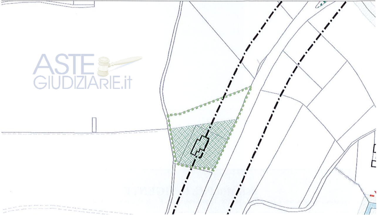
Figura 1_Estratto PR.B.1.1