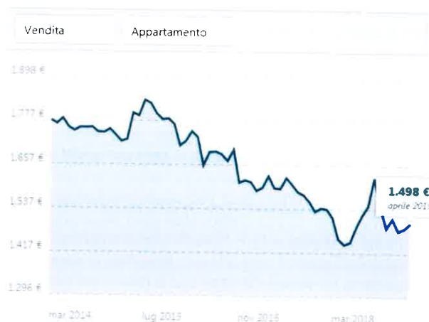
Immagine n.3: andamento quotazioni mercato immobiliare Comune di Albavilla - Fonte Immobiliare.it

Per la redazione della presente relazione e per la definizione del valore di stima è stata effettuata una ricerca presso la ex conservatoria di Como al fine di verificare la presenza di eventuali compravendite avvenute per immobili similari per tipologia e ubicazione a quelli oggetto di valutazione, inoltre, ci si è avvalsi delle informazioni reperite presso operatori del settore immobiliare e siti internet di rilevanza nazionale i cui risultati sono riportati di seguito.