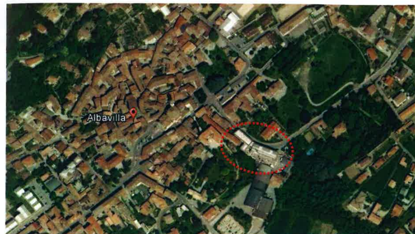
Immagine 2 - Inquadramento generale