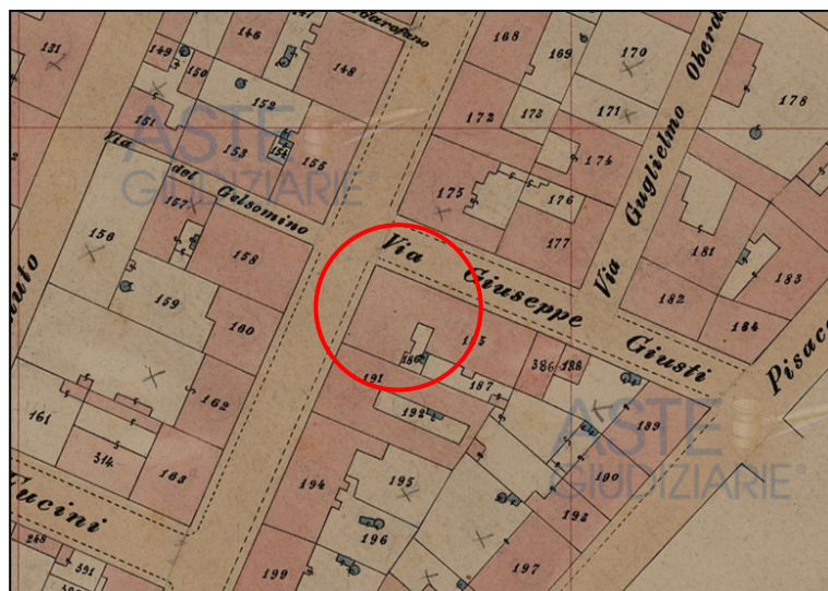
Estratto mappa catastale d’impianto del 1939

Il fondo è parte di un complesso edilizio realizzato prima del 1939, come dimostra la mappa d’impianto catastale del 1939, e la prima planimetria raffigurante l’immobile corrisponde alla planimetria catastale del 19/11/1952.