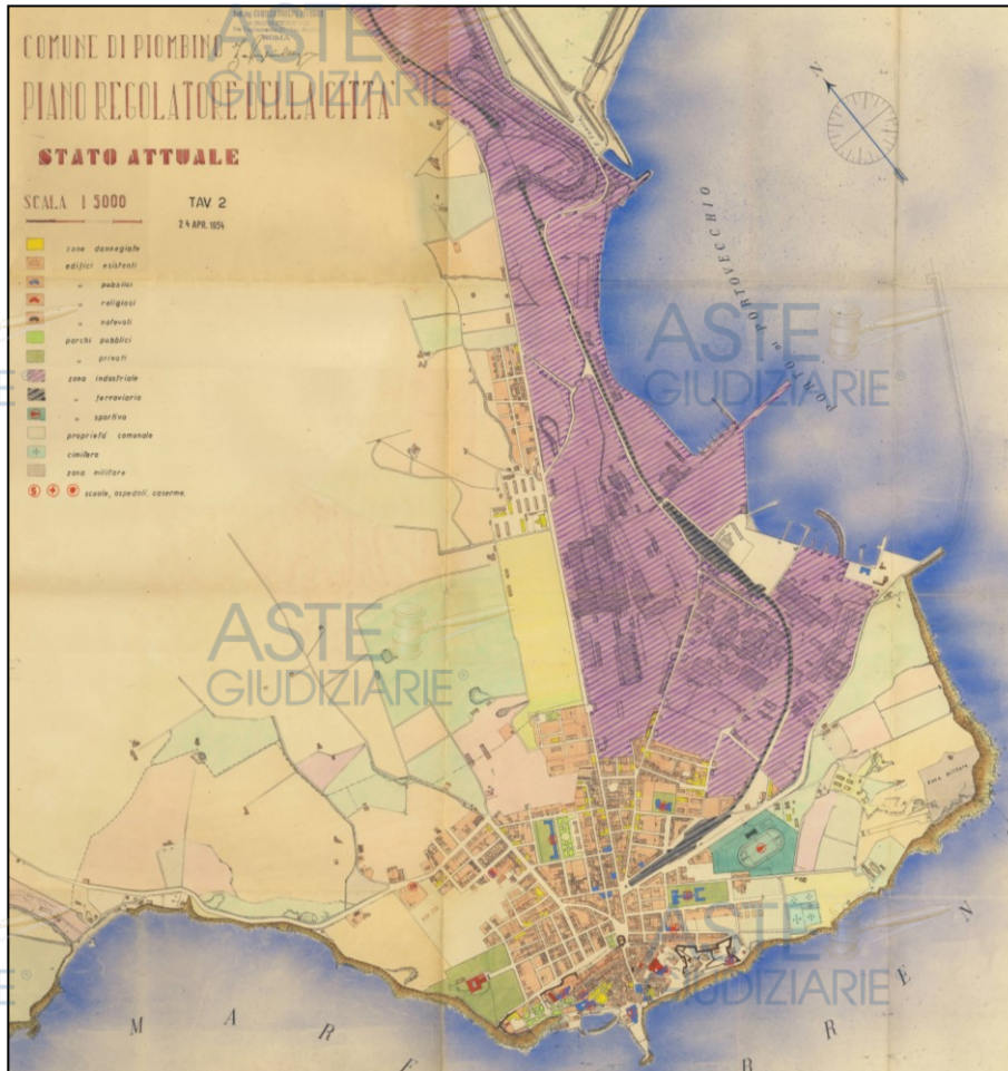
Piano Regolatore della Città – Tav. 2 del 24/04/1954

Il primo strumento urbanistico di Piombino è il P.R.G. redatto dall'Ing. Camillo Puglisi Allegra (aa. 1950 - 1955), approvato dal Consiglio Comunale con delibera n. 51 del 30/06/1954 (approvazione del P.R.G. modificato) e delibera n. 52 del 15/04/1955 (esame della controdeduzione e approvazione).