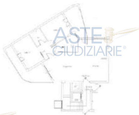
PIANO SECONDO F. = 2.70