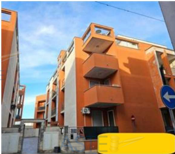
Prospetto fabbricato condominiale su via marconi