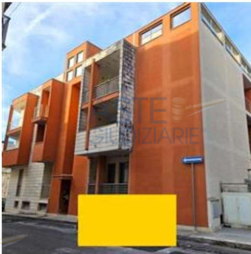
Prospetto fabbricato condominiale su via marconi