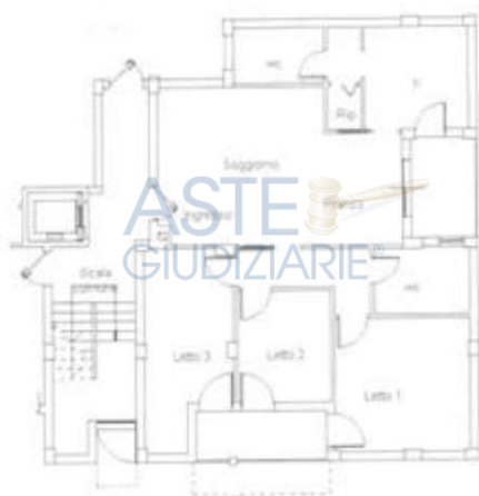
Planimetria catastale attuale