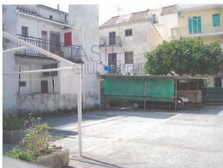
PIAZZALE - PARCHEGGIO SCOPERTO