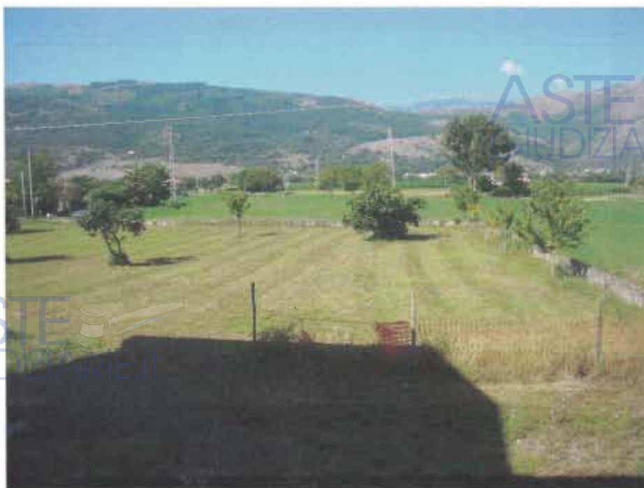
TERRENO ALLE SPALLE DEL FABBRICATO