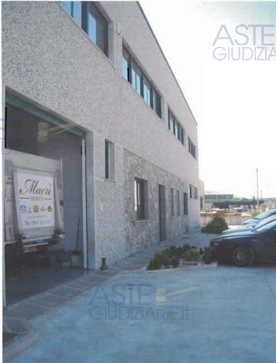
PROSPETTO PRINCIPALE OPIFICIO