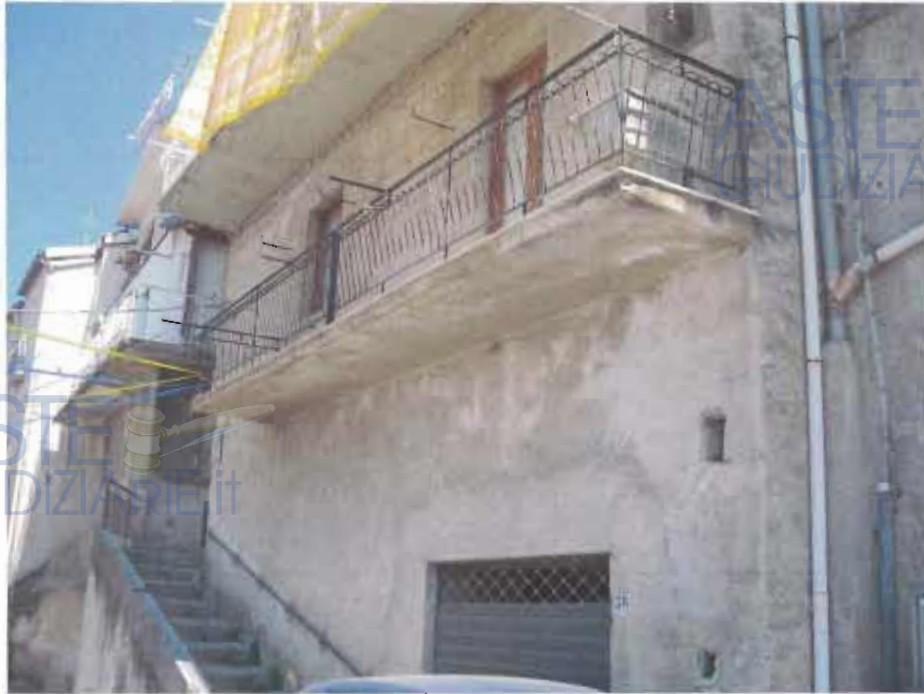
PROSPETTO DEL FABBRICATO SU STRADA