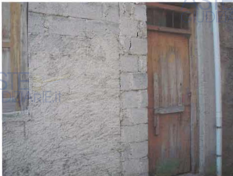
PIANO TERRA - INGRESSO ABITAZIONE

Punto 5) Bene immobile: Fabbricato rurale