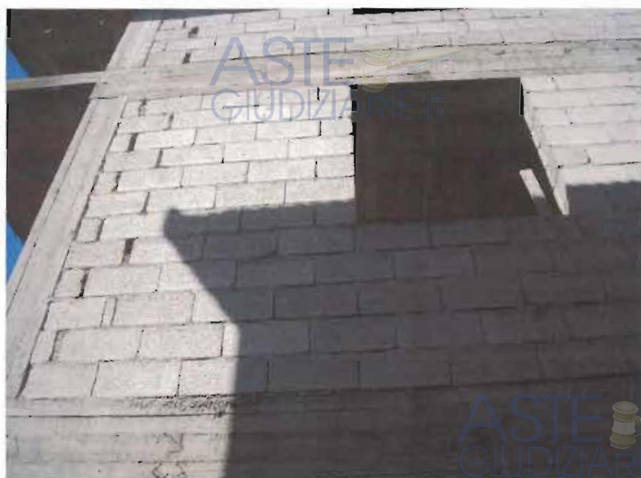
PIANO PRIMO - ABITAZIONE