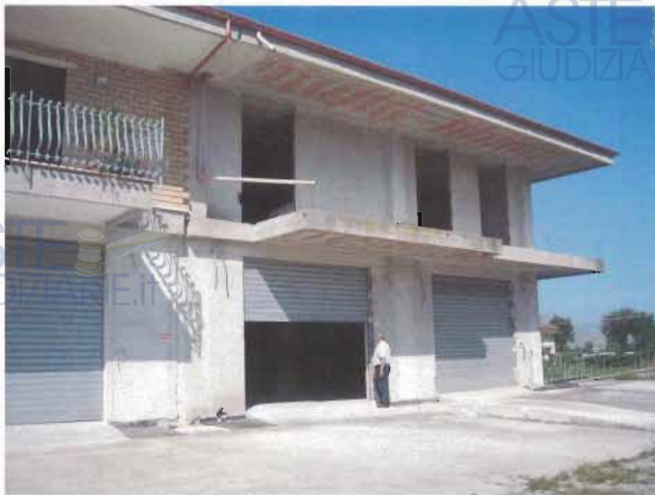
PROSPETTO PRINCIPALE SULLA SS19