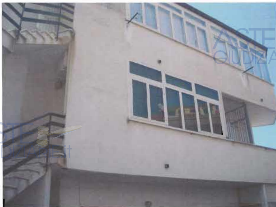
ABITAZIONE PIANO PRIMO