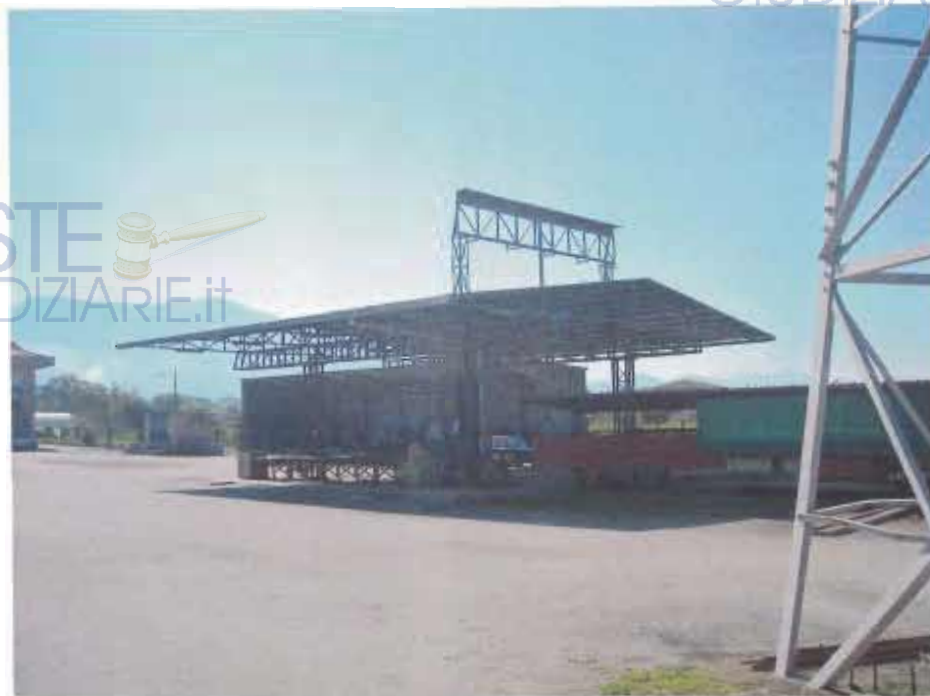
PIAZZALE CON STRUTTURE METALLICHE