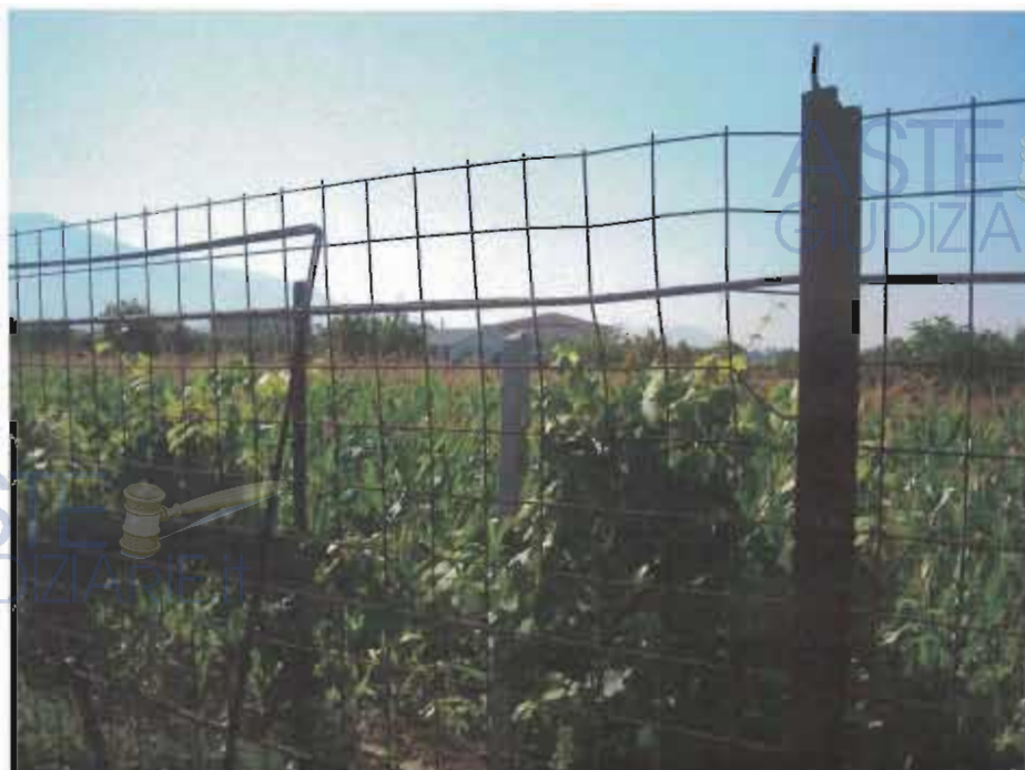
TERRENI LIMITROFI AL COMPLESSO ARTIGIANALE

Dati Catastali: Foglio 17 - Particella 87 - 109