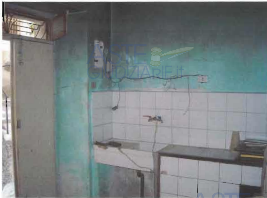
VISTA INTERNA ALL'ABITAZIONE