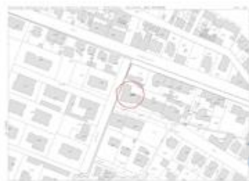
estratto di mappa