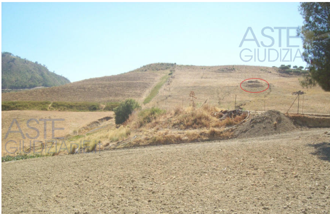
Foto n° 2: Cerchiata in rosso l'area di sedime del fabbricato rurale demolito (fgl. 149, part. 36)