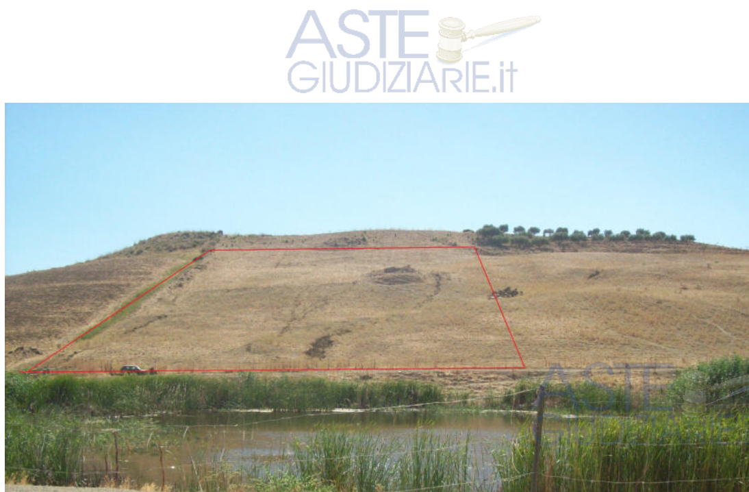
Foto n° 1: Vista dell'appezzamento di terreno identificato con la particella 37 del foglio di mappa 149