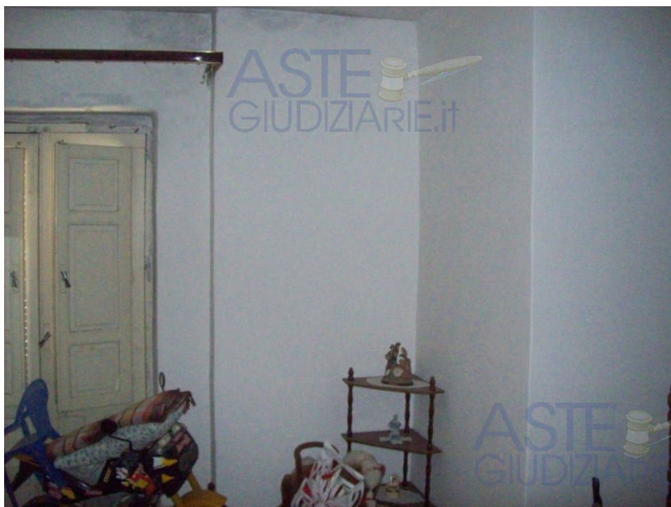
Foto n° 21: Interno | primo piano | camera da letto | vista verso il vano scala