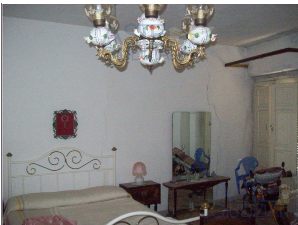
Foto n° 18: Interno | primo piano | camera da letto | si rileva la presenza di n. 2 lesioni discendenti