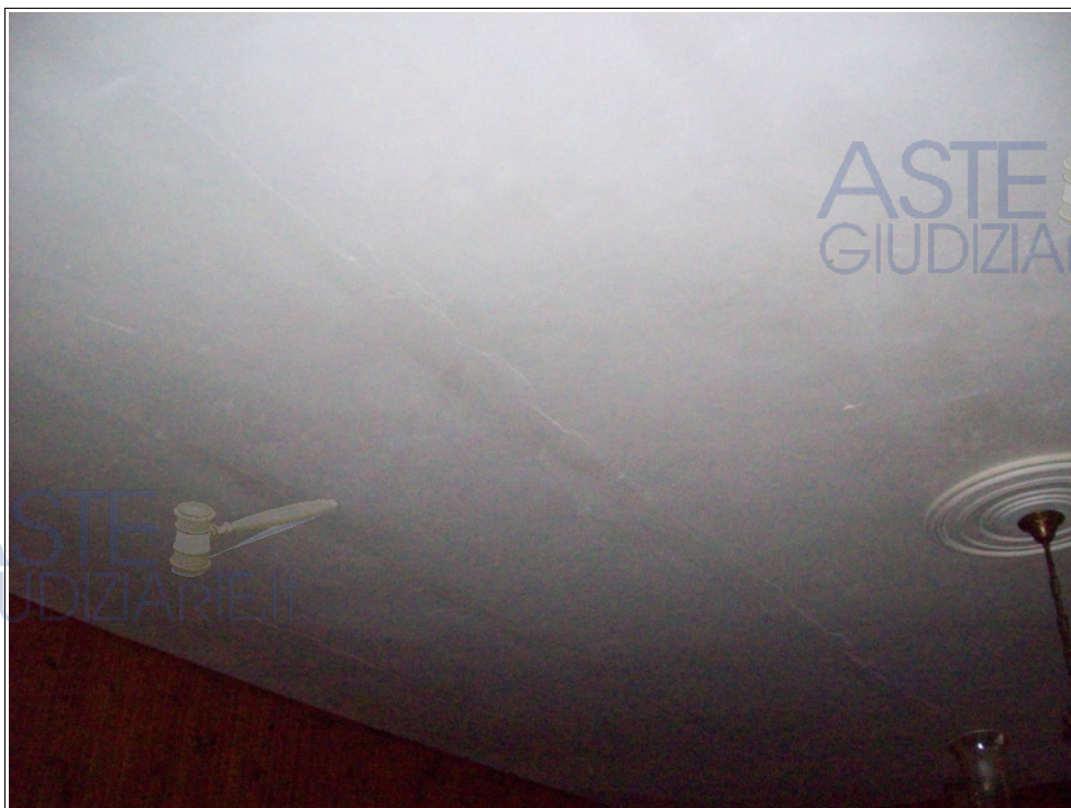
Foto n° 11: Interno | pianoterra | intradosso del solaio dell'ambiente pranzo-soggiorno | si rileva la presenza di lesioni disposte parallelamente alle travi.