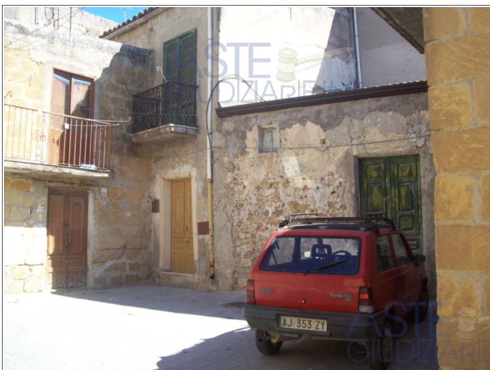
Foto n° 5: Esterno | vista dell'antistante corte comune identificata in catasto al fgl. 224, part. 633.