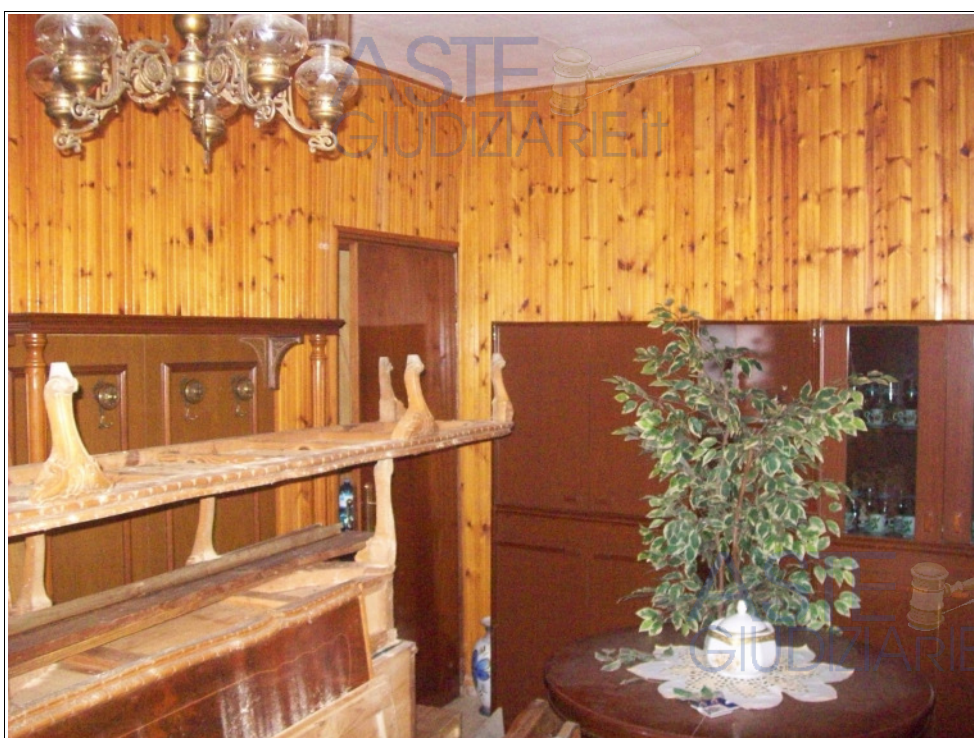
Foto n° 8: Interno | pianoterra | pranzo-soggiorno | vista verso il ripostiglio