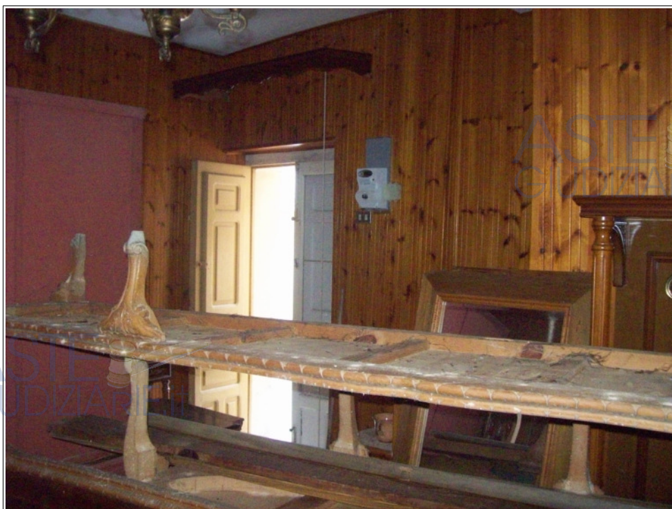
Foto n° 9: Interno | pianoterra | pranzo-soggiorno | vista verso la porta di ingresso