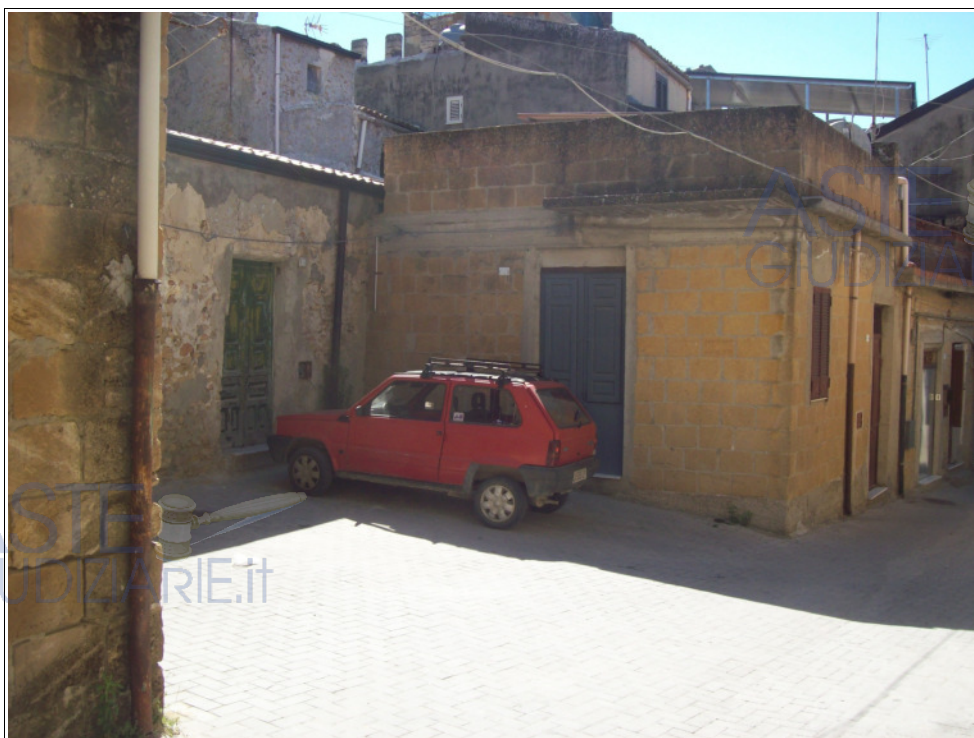
Foto n° 5: Esterno | vista dell'antistante corte comune identificata in catasto al fgl. 224, part. 633.