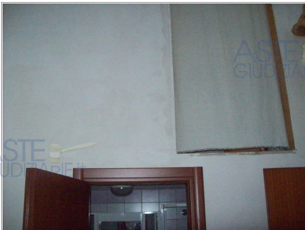
Foto n° 17: Interno | pianoterra | accesso al ripostiglio soppalcato dalla cucina