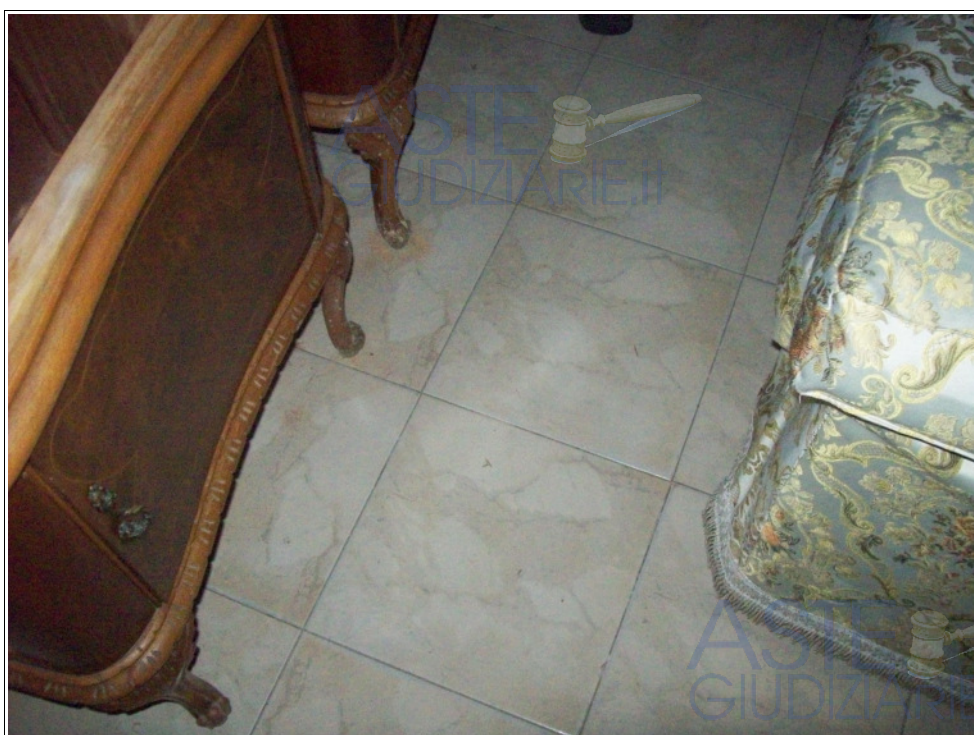
Foto n° 10: Interno | pianoterra | pranzo-soggiorno | pavimentazione in gres porcellanato smaltato.