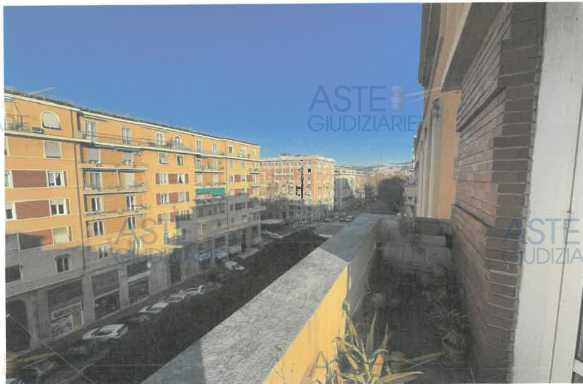
ASTE GIUDIZIARIE® FOTO 12