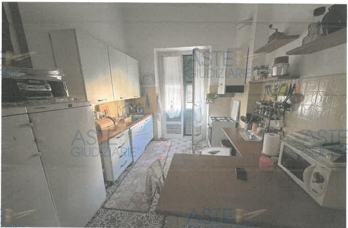
ASTE GIUDIZIARIE® FOTO 10