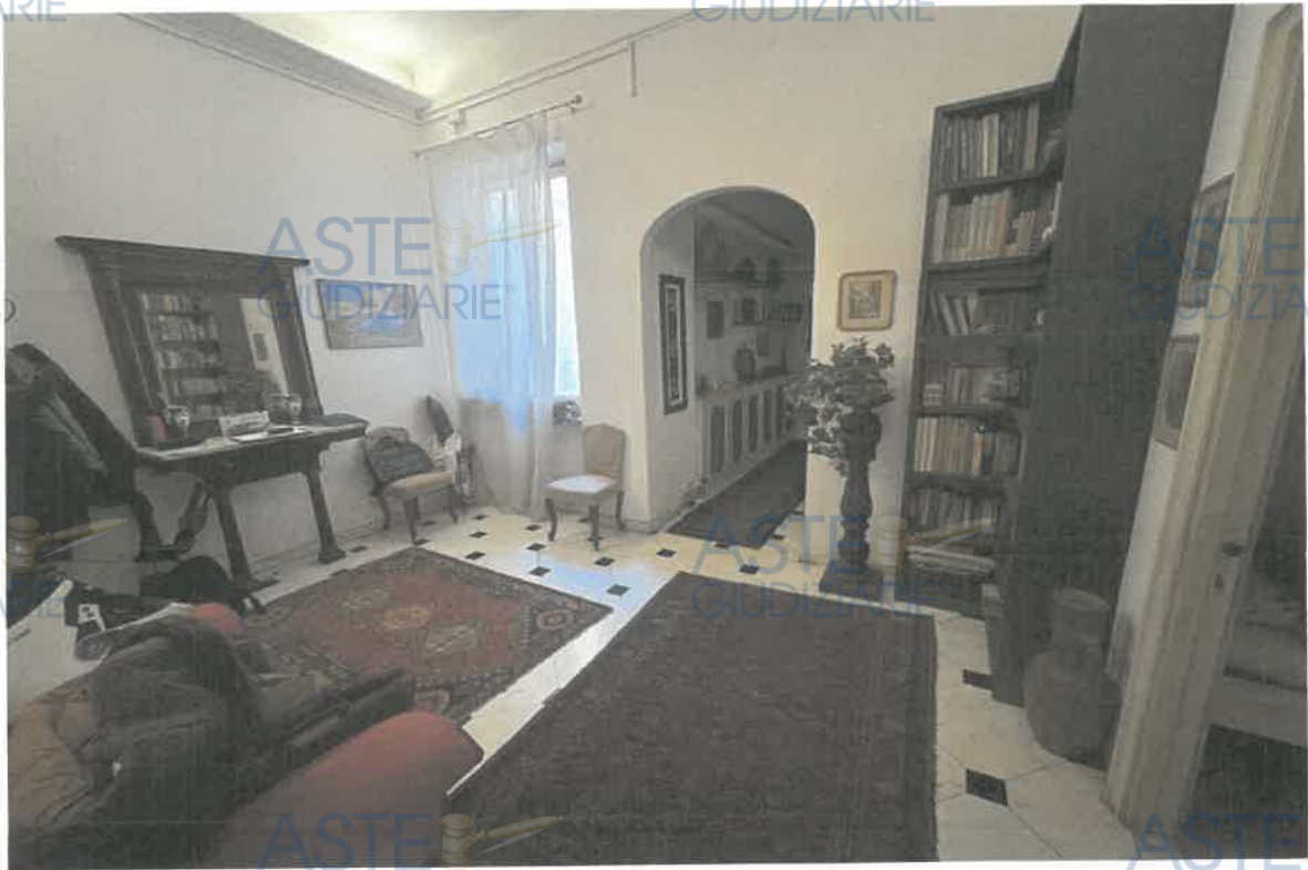
ASTE GIUDIZIARIE® FOTO 3