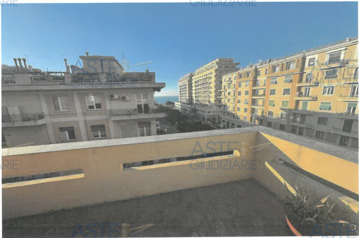
ASTE GIUDIZIARIE® FOTO 11