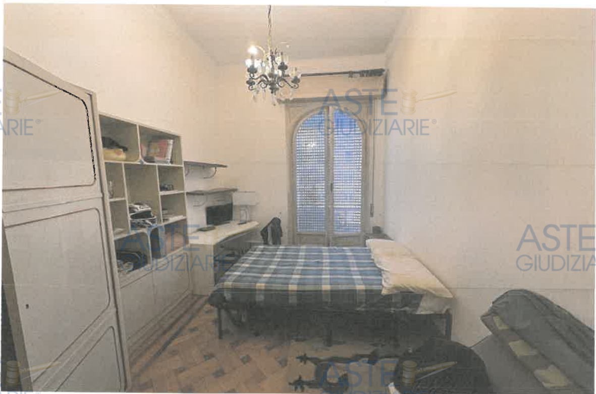
ASTE GIUDIZIARIE® FOTO 6