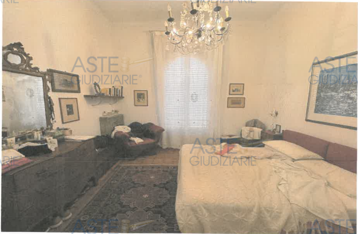
ASTE GIUDIZIARIE® FOTO 5