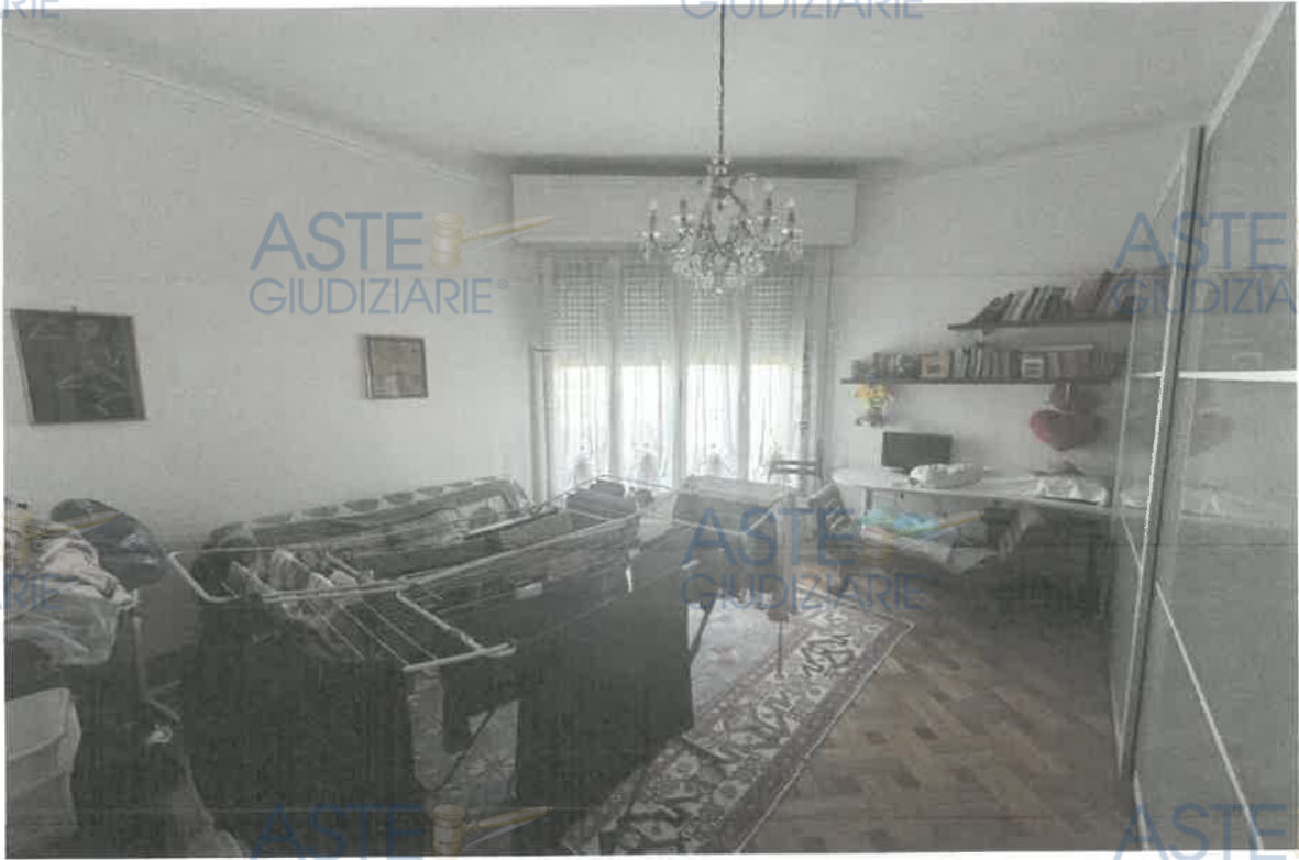
ASTE GIUDIZIARIE® FOTO 7