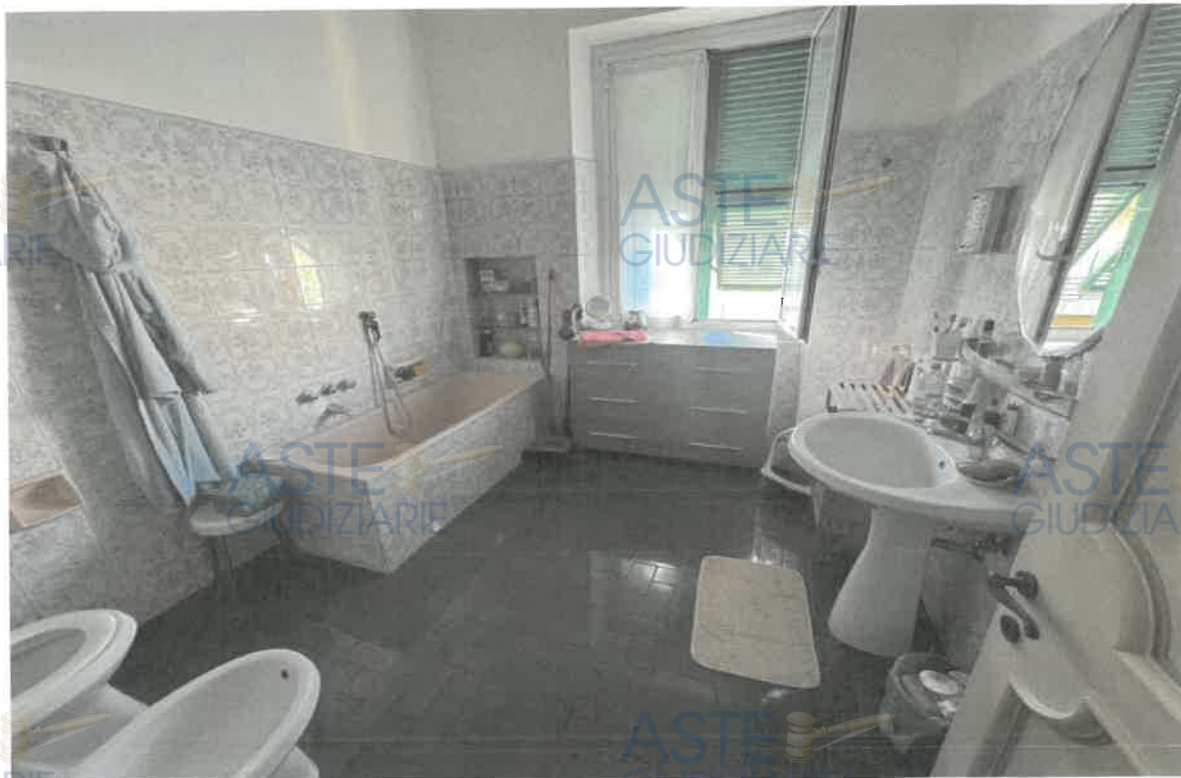
ASTE GIUDIZIARIE® FOTO 8