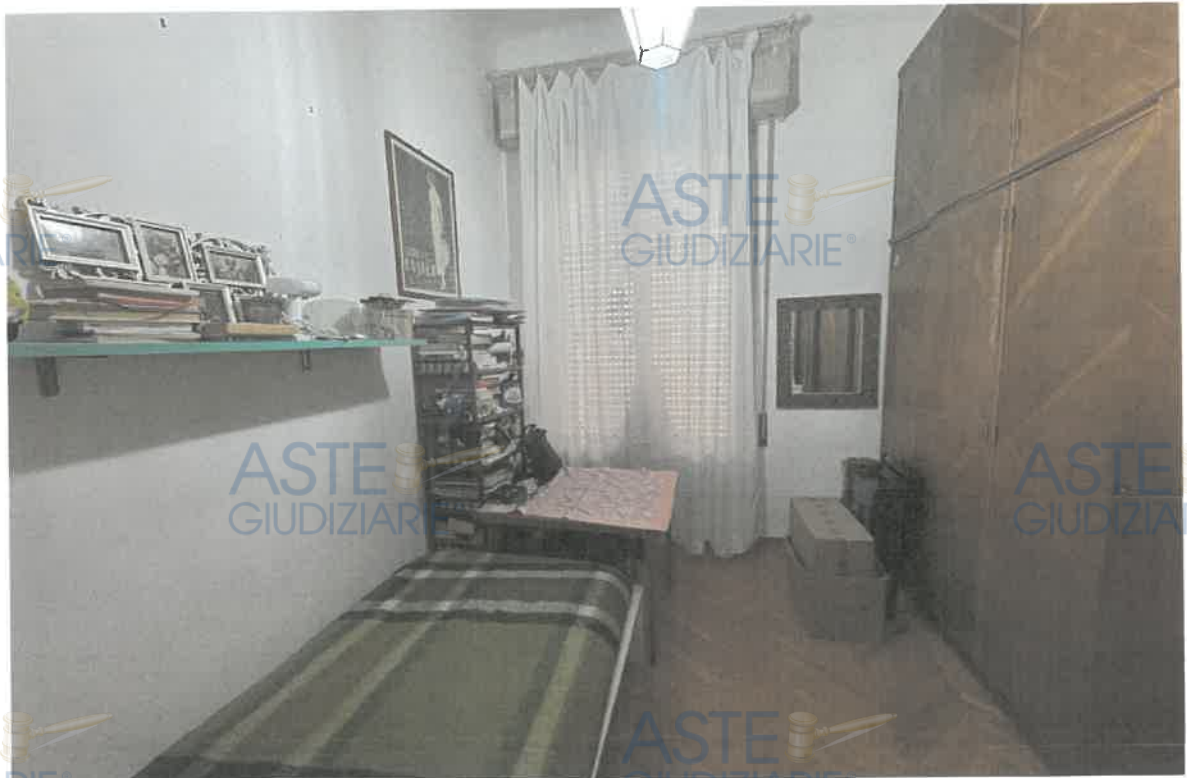
ASTE GIUDIZIARIE® FOTO 4