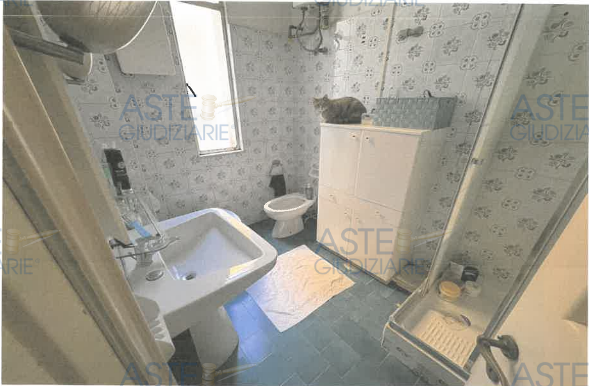
ASTE GIUDIZIARIE® FOTO 9