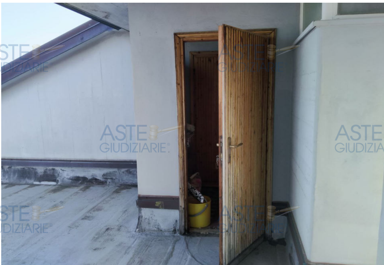
Fot.8 - Vista dell'ingresso al lastrico solare dal vano scale condominiale.