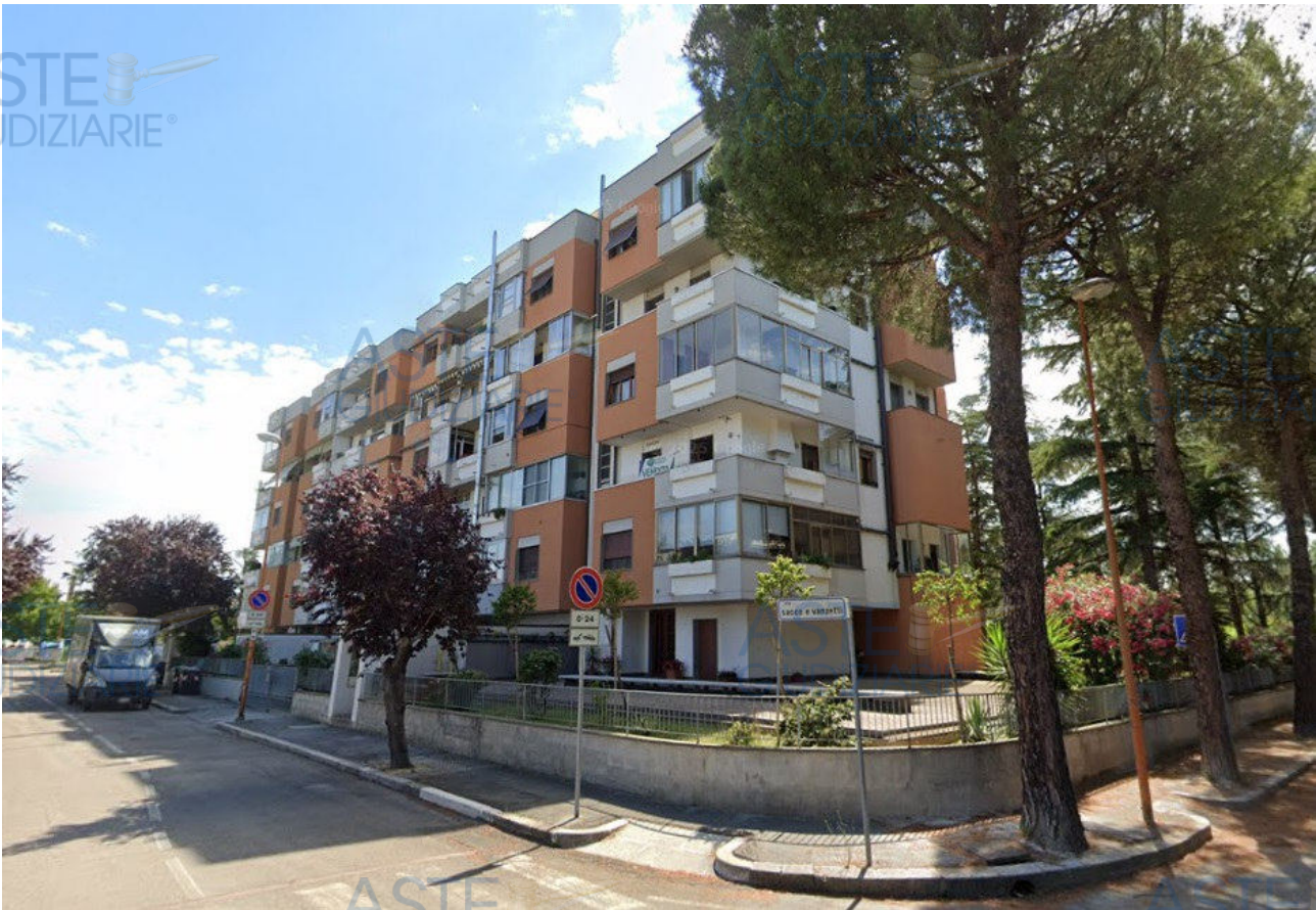
Fot.2 - Vista del complesso residenziale "****OMISSIS****" da Via Sacco e Vanzetti.