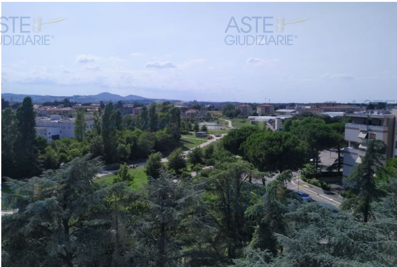
Fot.7 - Vista del panorama di Cesena dal lastrico solare.