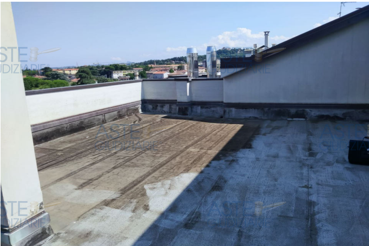
Fot.4 - Vista del lastrico solare