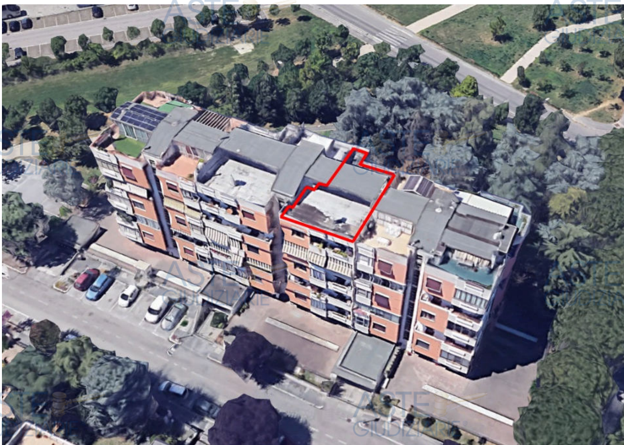
Fot.1- Individuazione del complesso residenziale "****OMISSIS****" in Via Sacco e Vanzetti . Con la bordatura rossa il lastrico solare.