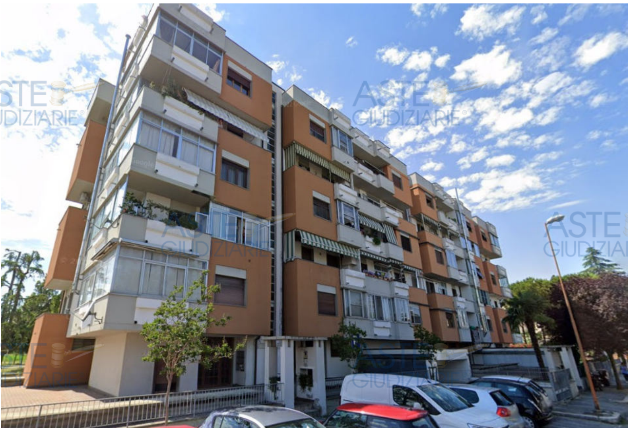
Fot.3 - Vista del complesso residenziale "****OMISSIS****" da Via Sacco e Vanzetti.