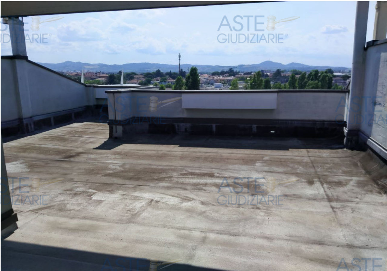
Fot.4 - Vista del lastrico solare.