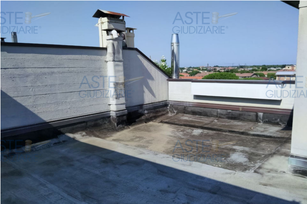
Fot.5 - Vista del lastrico solare