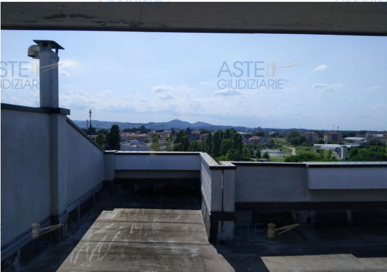
Fot.6 - Vista del lastrico solare.