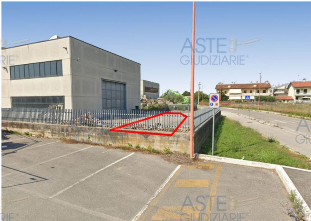
Foto 2- Vista dell'immobile esecutato dal parcheggio di Via Olof Palme.