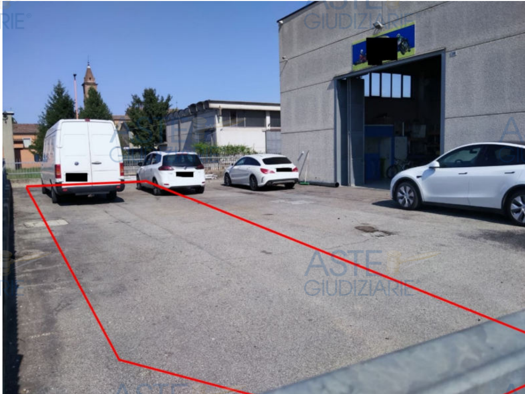
Foto 1- Vista dell'immobile esecutato all'interno della ditta "Motor Seven".