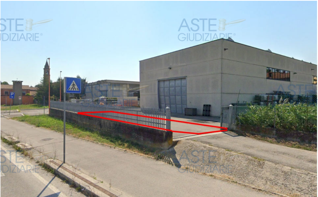
Foto 3- Vista dell'immobile esecutato da Via Olof Palme.