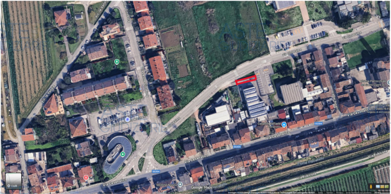
Individuazione dell'immobile all'interno del perimetro della ditta "**** OMISSIS****"