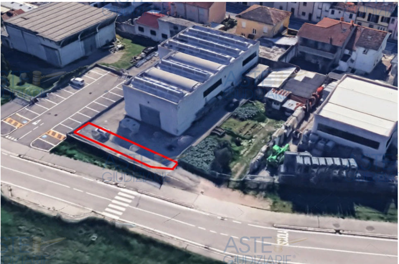
Foto 4- Vista dell'immobile esecutato dall'alto.