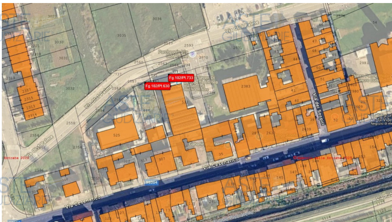
Individuazione dell'immobile in Via Olof Palme nella frazione di Macerone di Cesena.

Particella con qualità: seminativo arborato di classe 2.