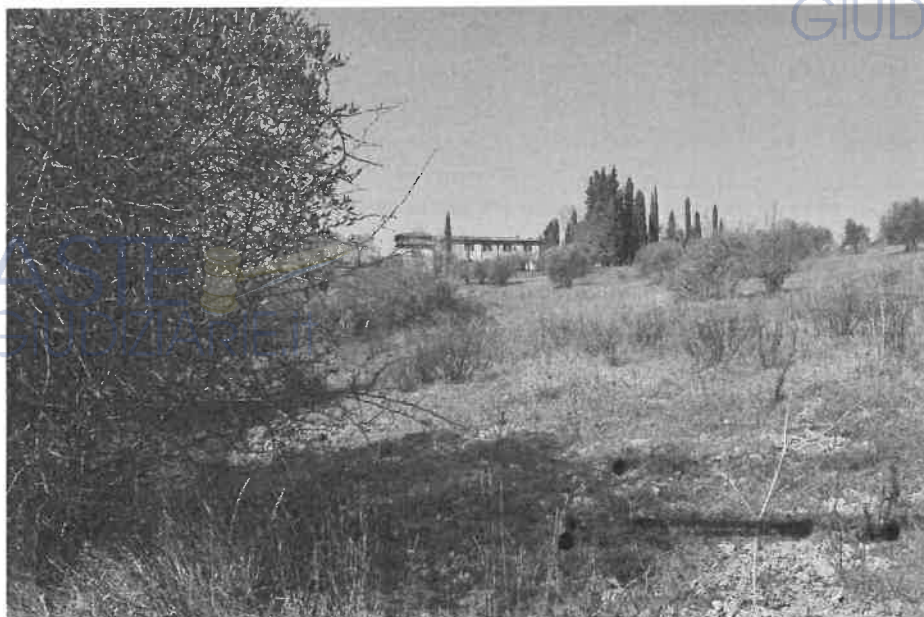
Terreni particella 48 più in alto 217 (con ulivi) – sullo sfondo Valagri Alto

La residua parte della particella 48 si presenta incolta, con arbusti e vegetazione spontanea. Ai terreni si accede attraverso strada sterrata che si diparte dalla via del Ferrone; è una strada vicinale (strada vicinale di Valagri) posta proprio sul crinale del versante collinare, così le particelle di cui al LOTTO 4 si trovano sul versante sud della collina.