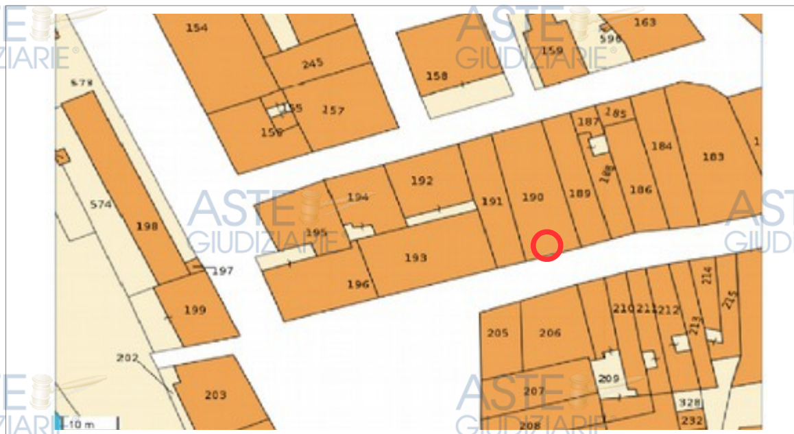
Fig. n.1: Stralcio estratto di mappa catastale – Comune Castelfiorentino FI - Foglio 51, Particella 190

Si riportano di seguito uno stralcio dell'estratto di mappa catastale dell'unità immobiliare.