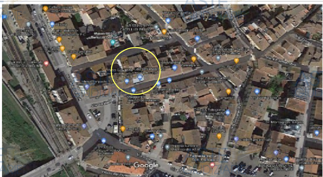
Fig. n.2 : Orto-foto della zona

Il lotto individuato per la vendita è situato nel Comune Castelfiorentino in Via Garibaldi n.36.