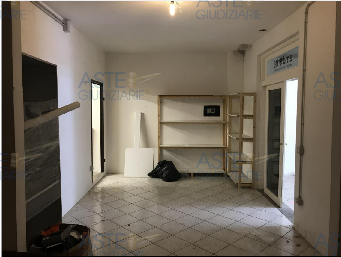
Viste dell'ufficio in via XXXXXXXX n°20