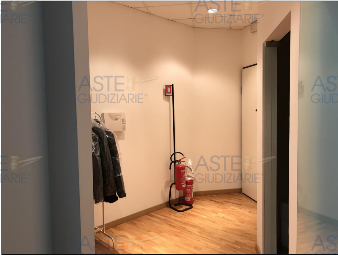
Ingresso e servizio igienico