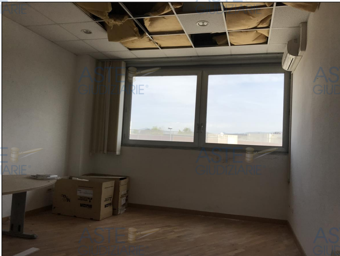
Viste degli uffici dismessi