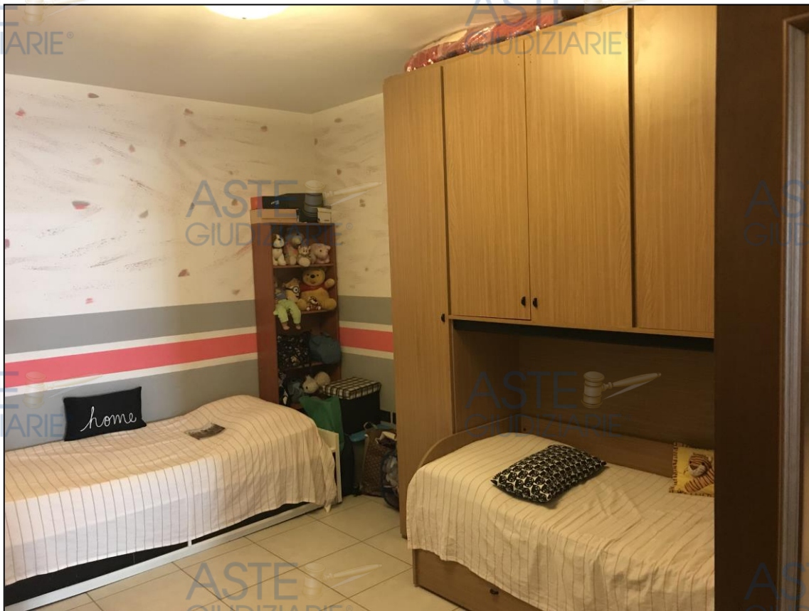
Vista dei due locali privi di finestre