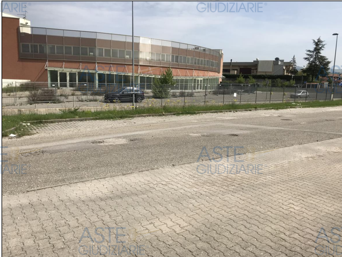
Vista dei tre posti auto

Rimanendo a disposizione per qualsiasi eventuale chiarimento, il sottoscritto consegna la propria relazione peritale alle parti in causa e alla Cancelleria del Tribunale di Firenze.