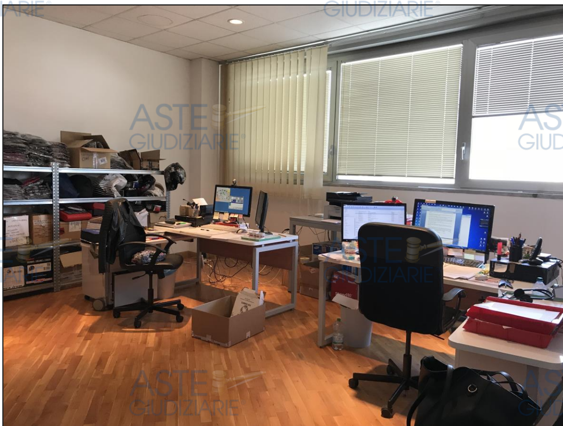
Viste degli uffici