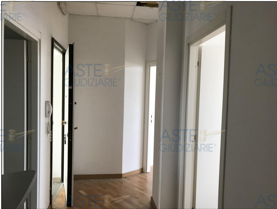
Viste degli uffici dismessi