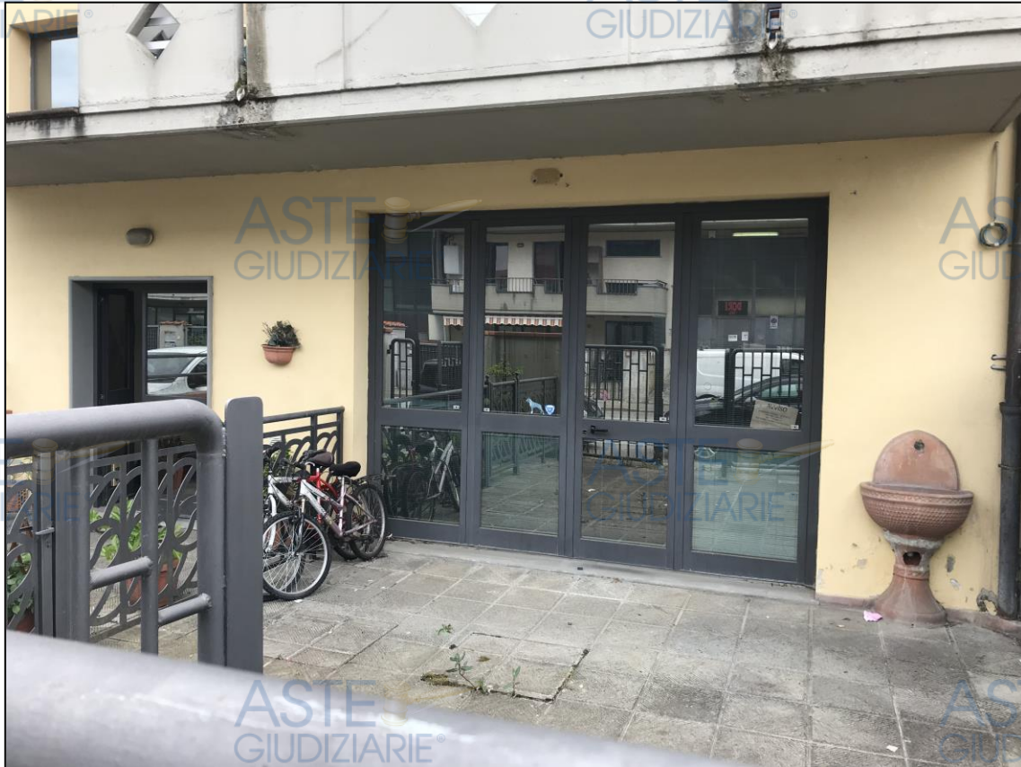
Viste dell'ufficio di via XXXXX n° 20