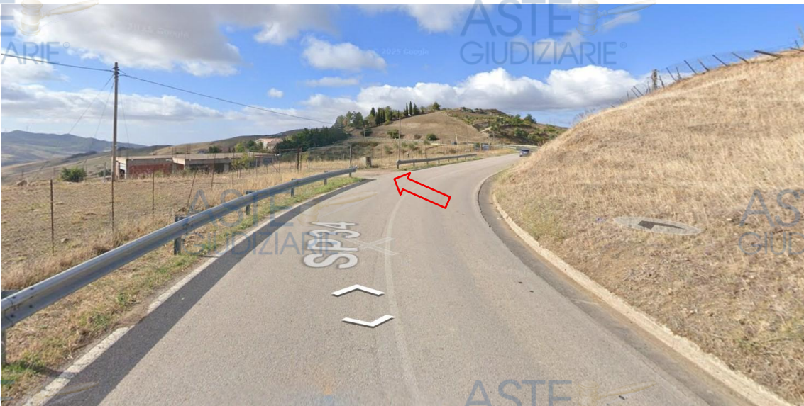
Foto passo carraio