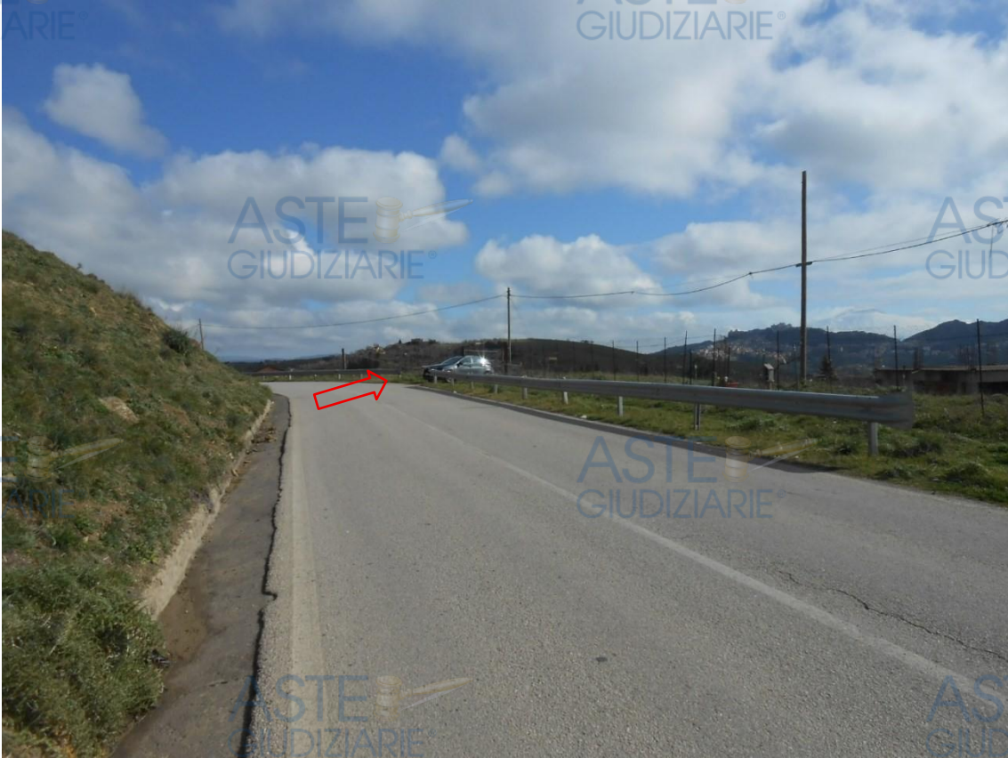
Foto passo carraio