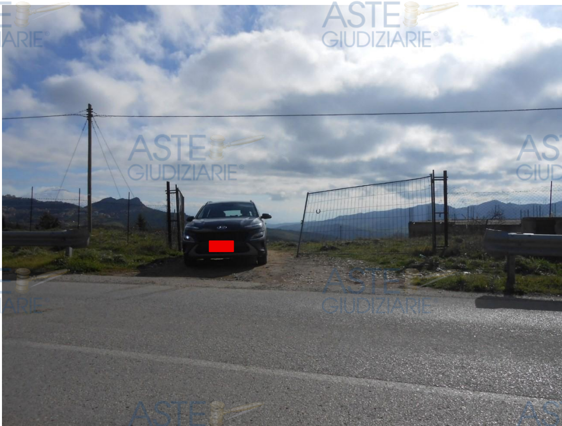
Foto passo carraio

Il passo carraio esistente, dovrà in ogni caso rispettare, le distanze di visibilità previste ai sensi del Decreto del Ministero delle Infrastrutture e dei Trasporti del 19.04.06, punto 4.6 (triangolo di visibilità) e del D.M. 05.11.2001 (distanza di visibilità per l'arresto).