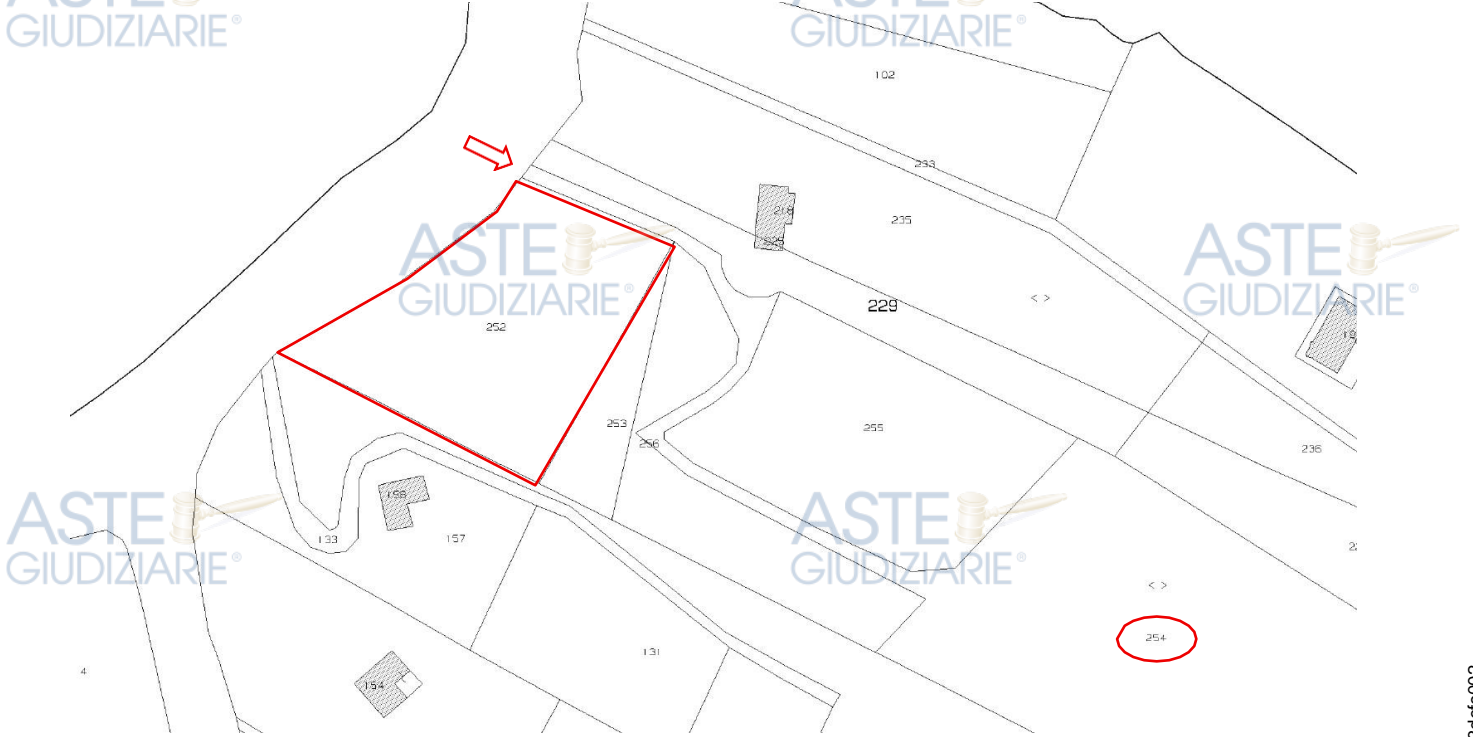
Stralcio mappa catastale al 01.01.2014