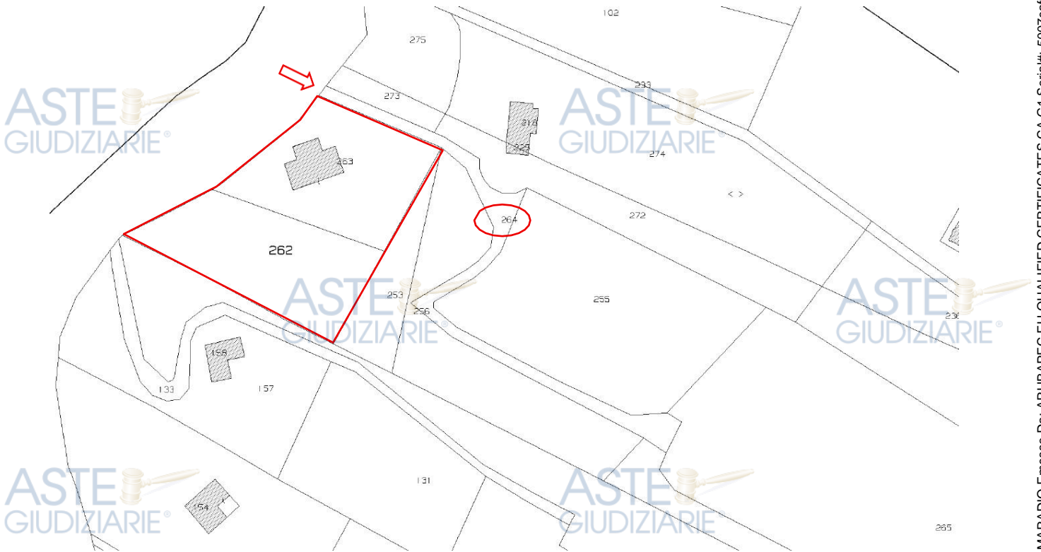
Stralcio mappa catastale al 30.03.2025