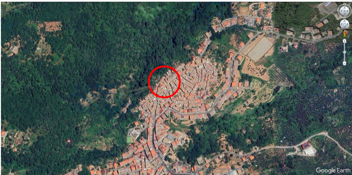
Immagine 1 – Inquadramento territoriale generale

I luoghi oggetto del presente studio sono ubicati nella Provincia di Catanzaro, nel territorio del Comune di Palermiti, come si può notare osservando le successive immagini 1, 2 e 3 tratte dall'applicazione web "Google Earth".