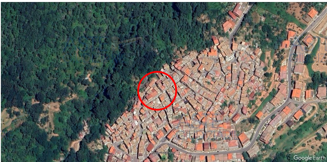
Immagine 2 – Inquadramento territoriale generale