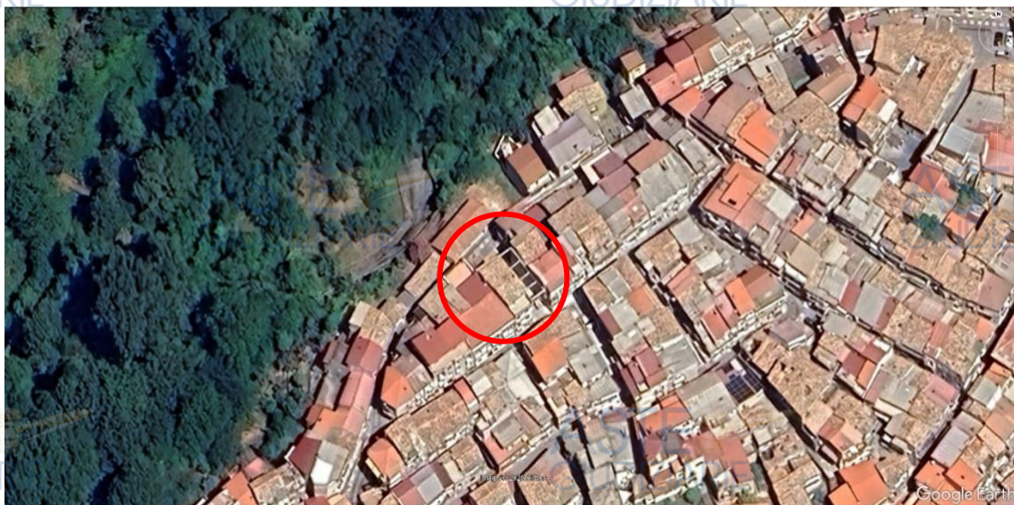
Immagine 3 – Inquadramento territoriale di dettaglio

Nel dettaglio, il bene immobile occupa un fabbricato multipiano con destinazione d'uso residenziale costituito da quattro livelli fuori terra con distribuzione verticale formata da apposita scala, non munito di ascensore, ed è ubicato in Via Umberto I n. 15.