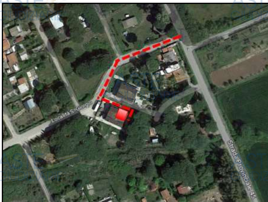
Individuazione dell'immobile – Google maps

È ubicato in loc. San Giorgio ed è facilmente raggiungibile dalla strada litoranea, ed è situato in una zona tranquilla, di campagna. Non sono presenti servizi nelle immediate vicinanze. I centri commerciali più vicini distano circa 6 km (Tarquinia) e 10 km (Civitavecchia). Il mare si trova a circa 2,5 km.