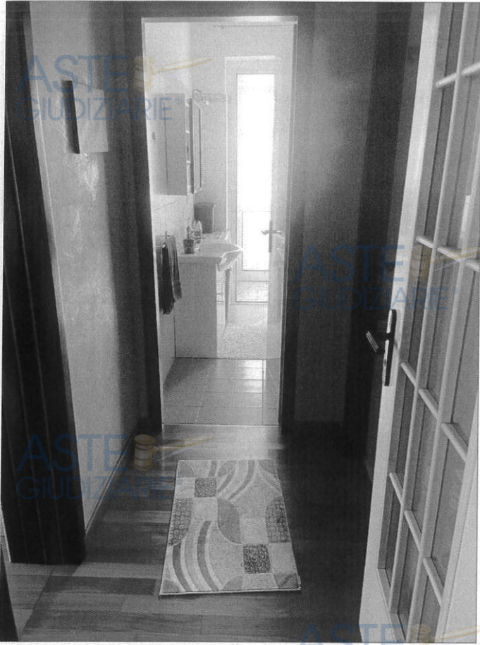
Disimpegno zona giorno