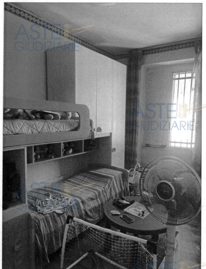
Stanza da letto ragazzi