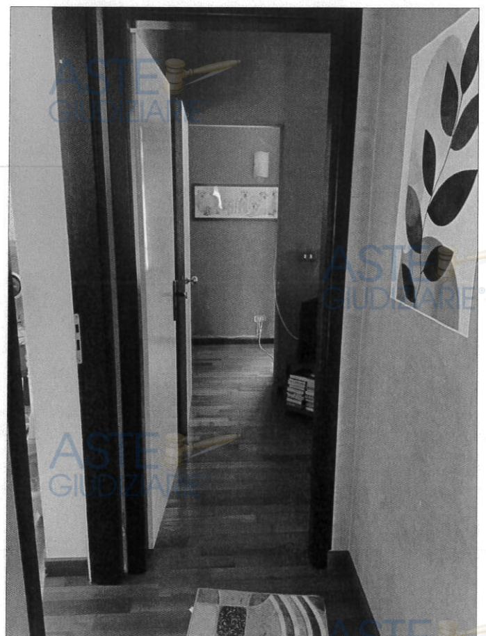
Disimpegno zona notte