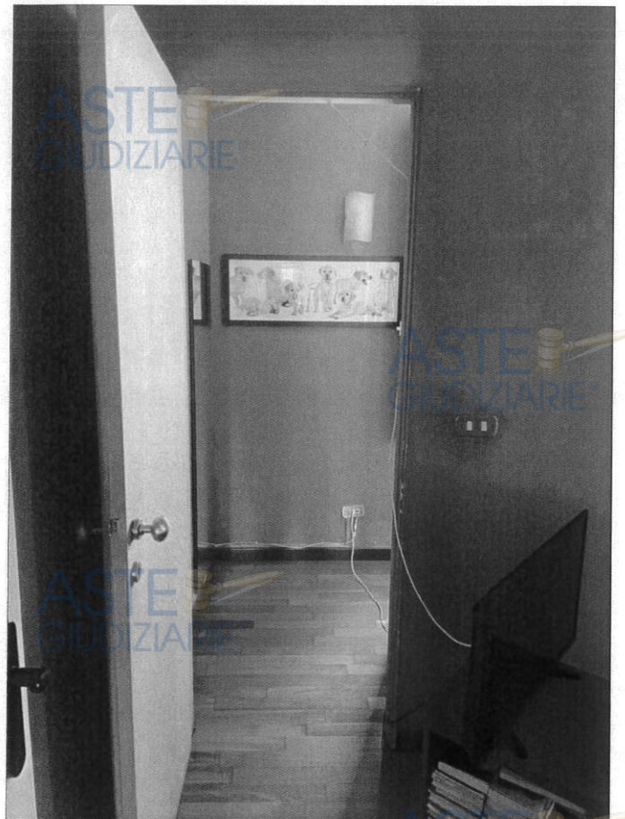
Stanza da letto matrimoniale