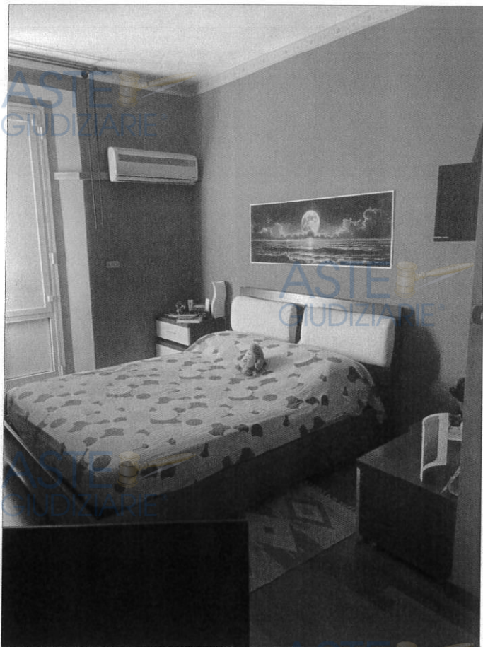
Stanza da letto matrimoniale