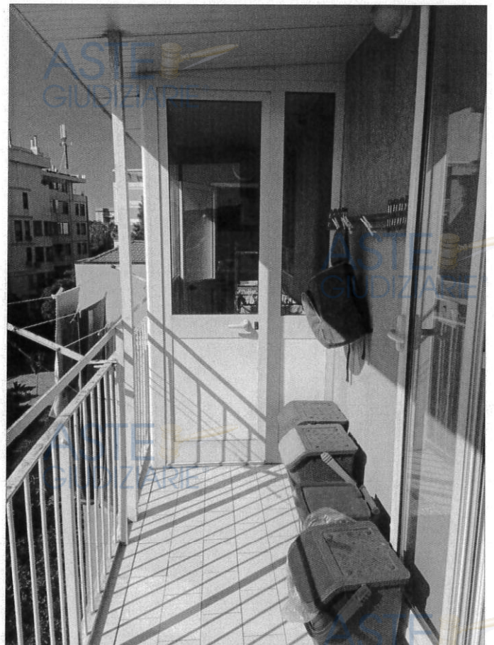
Balcone cucina - veranda