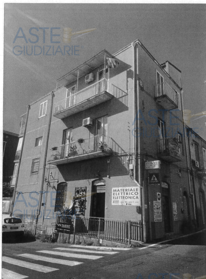
Prospetto nord - est