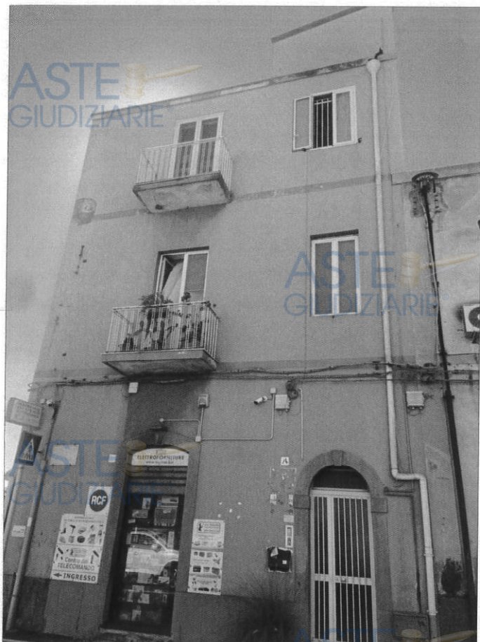
Prospetto nord - ovest