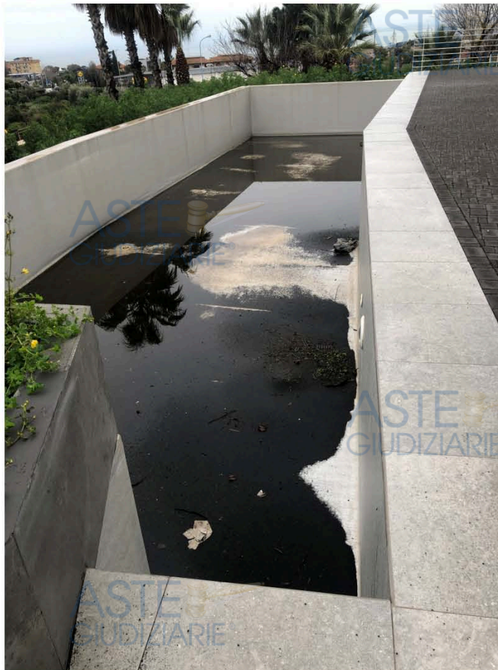
Vista immobile di cui al punto 6)

Il lotto di terreno sul quale sono stati realizzati gli immobili di cui ai punti precedenti confina, a nord, con lotto di terreno appartenente ad altra ditta, a sud con area a verde, ad est con la via del Carabiniere e ad ovest con la via Etna ed altra ditta ed è dotato di accesso da entrambe le strade con cui