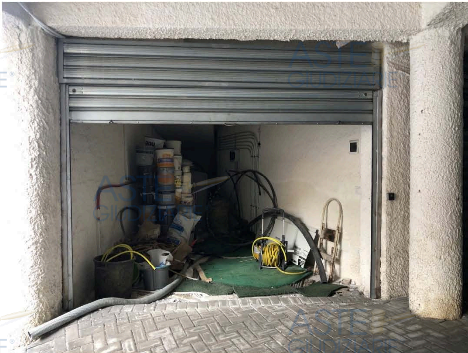
Vista immobile di cui al punto 5)