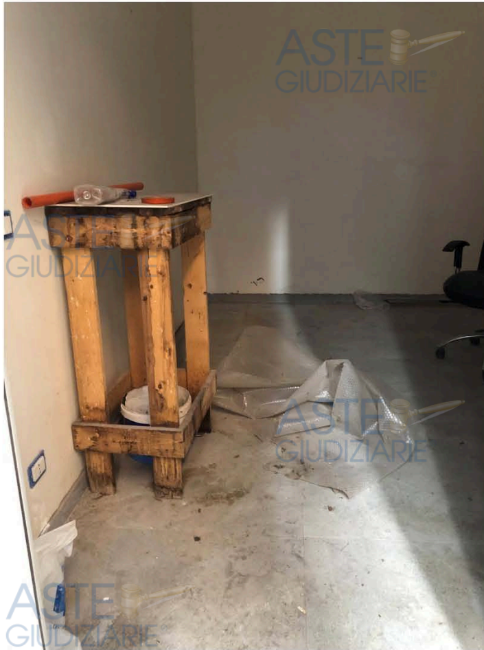
Vista immobile di cui al punto 4)